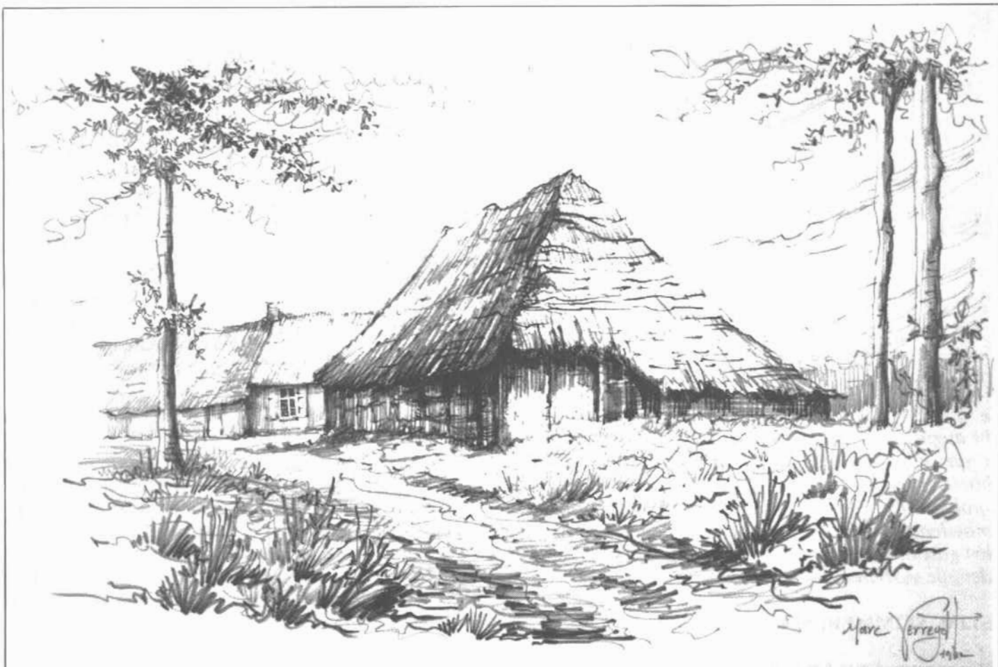
● De hoeve van de Wijngaardsbergen : alweer verdwenen schoonheid

DRIEMAANDELIJKS TIJDSCHRIFT HEEMKRING DAVIDSFONDS NIJLEN - NUMMER 4 - AUG. 1982