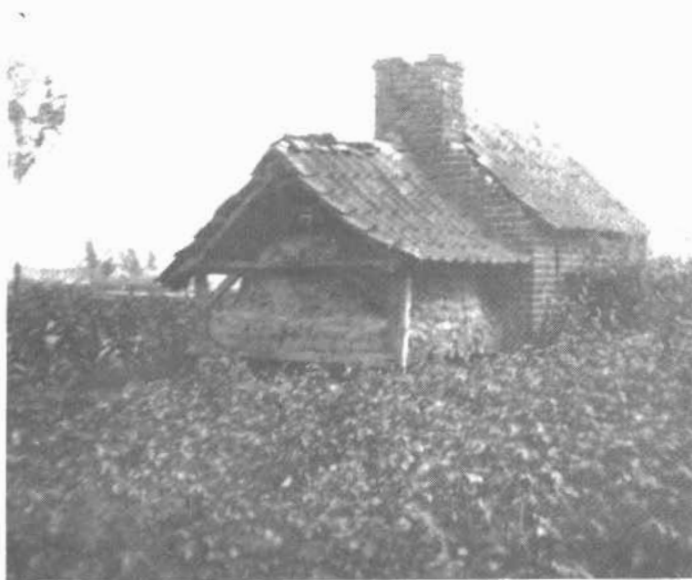
Typische, alleenstaande "ovenbuur": zeldzaam geworden bouwwerk.