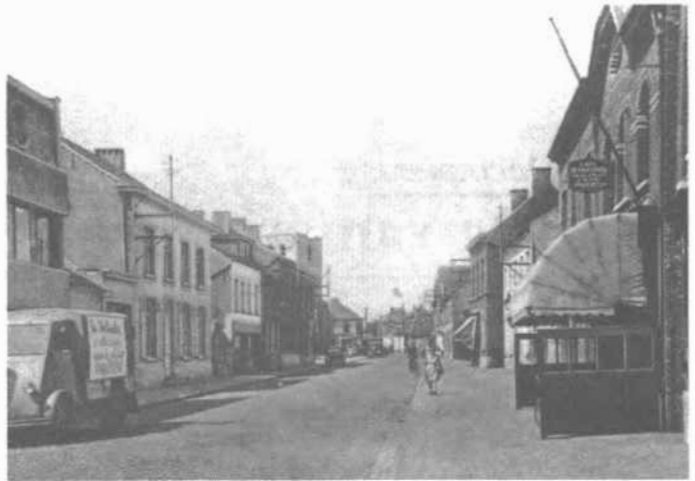
Links vooraan: "De Stad Herenthals".

Kent ge de kliek van de stronthoek nog? De Meir, de Kuille en Lowie van de Sjas. Ge weet wel wie die gareelmaker, die al zingend werkt in zijn deurgat aan halster, lederen riem of paardgetuig met een lange hesdraad, zwart gemaakt met een bol pek en aan de biede uiteinden voorzien van een scherpe naald, die tegelijk in tegengestelde richting werd geschoven in een gaatje dat vooraf met een els gestoken was.