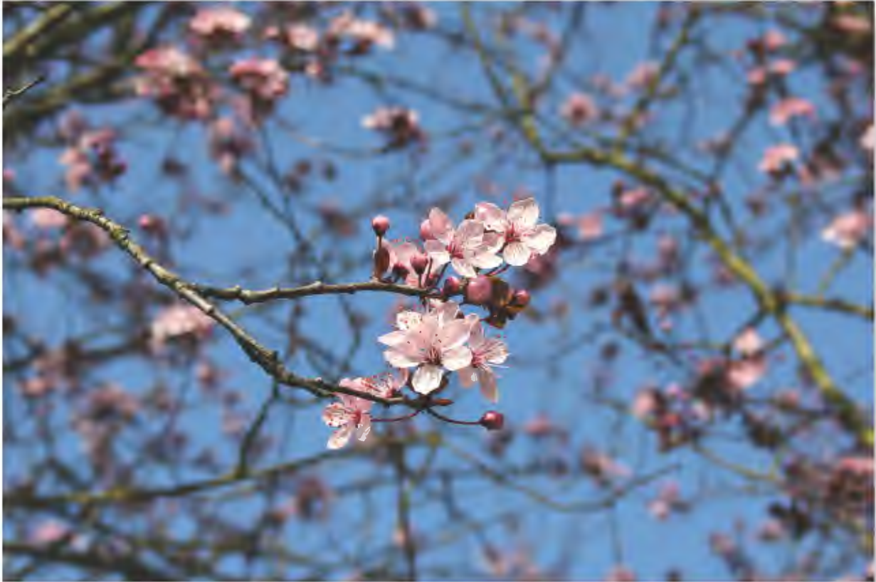
Lente 2017 Nijlen

NUMMER 106 □ 01-02-03-04-05-06/2021 □ P309458 □ AK2560 NIJLEN1