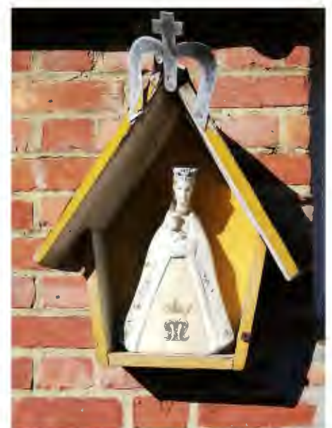
Rector de Ramstraat 47

In het parochieblad van 12 april wordt fier gemeld dat 702 parochianen een Mariakapel hadden aangevraagd. De daaropvolgende weken wordt de Mariale Hoogdag, de Koninginnedag, voorbereid. "Op 24 mei 1959 worden de kapelletjes om 14 uur in een plechtig Lof gewijd en uitgereikt aan de intekenaars." Hier werd gevraagd dat bij de naamafroeping liefst de vader de kapel in ontvangst komt nemen. De plechtigheid wordt afgesloten met de hernieuwing van de doopgeloften, de toewijding aan Onze-Lieve-Vrouw en het Magnificat.