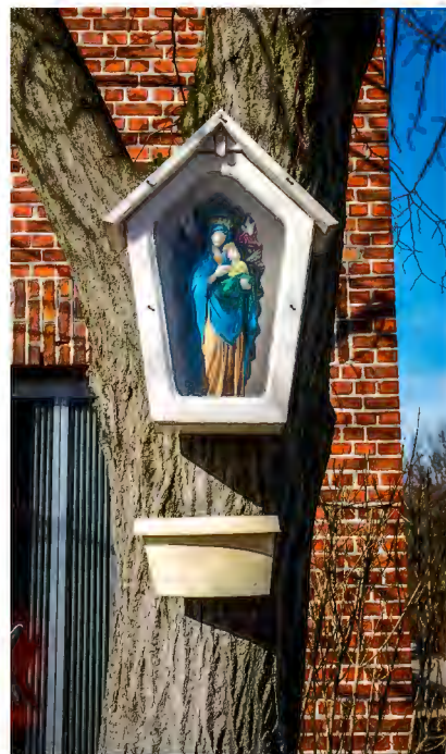
Lindekensbaan 25

Priscilla en Armand zitten ondertussen al aan 71 stuks en proberen de geschiedenis ervan te achterhalen, zodat het Nijlense erfgoed bewaard blijft.