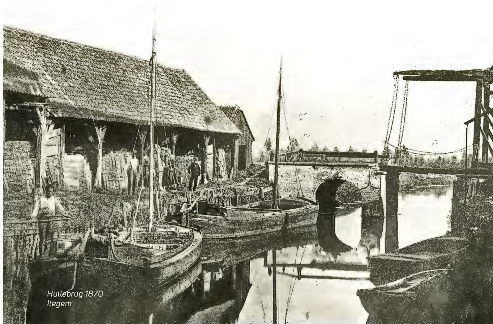
De Hillebrug anno 1870