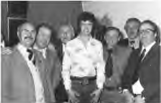
Foto genomen bij het optreden van Freddy Breck in de parochiezaal

Met wisselend succes richtte de kwb ook enkele jaren "De Bevelse kroegentocht" in. Ook zorgde zij voor optredens in de parochiezaal van o.a. Willem Vermandere, Bart Herman, Barbara Dex, Miek en Roel en The Original Jukebox Heroes.