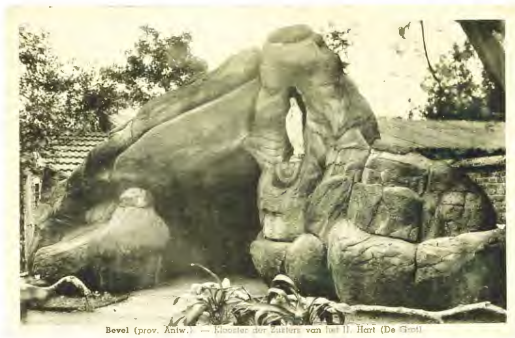
Bevel (prov. Antw.) — Klooster der Zusters van Sint J. Hart (De Grot)