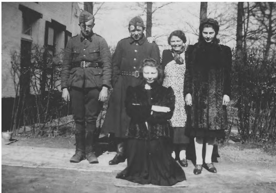
Foto genomen tijdens de mobilisatie in 1939 aan het huisje in 't Goor.

Onze soldaten kwamen van Adegem in Oost-Vlaanderen. Als ze onderling aan het praten waren, had onze familie het lastig om hen te verstaan! Adegems is wat anders dan Kessels of Nijlens! Vrij plots was het inpakken en wegwezen: de vijand kwam steeds dichterbij.