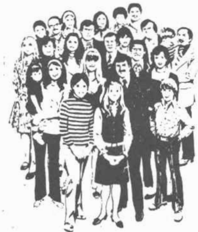
Mensen van bij ons