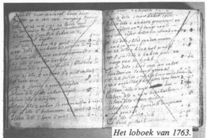
Het loboek van 1763.