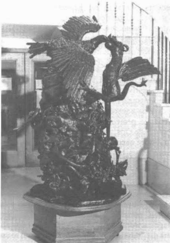
● De strijd van de arend met de draak : het levenswerk van de kunstsmid.