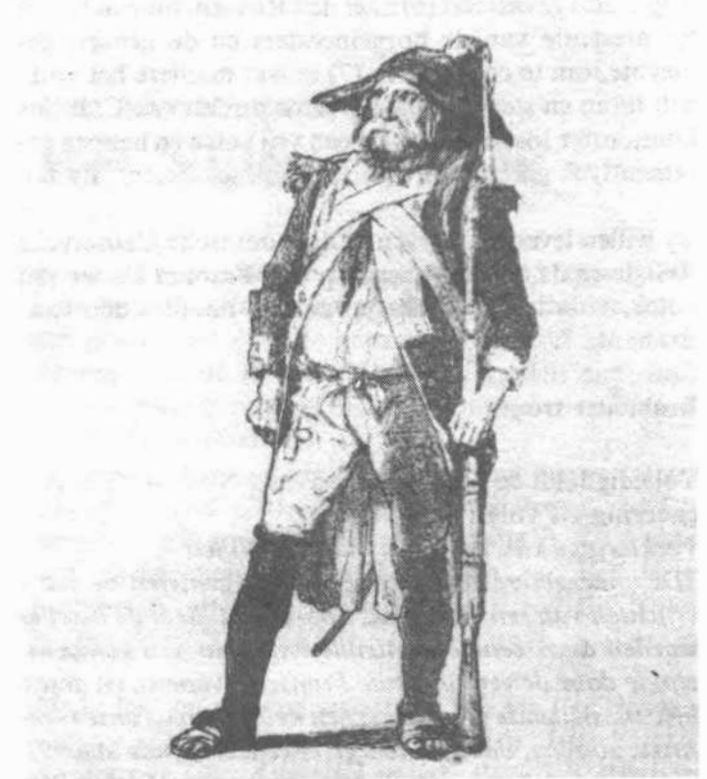
● De sansculot, brenger van „vrijheid, gelijkheid en broederlijkheid”

Op 20 april 1792 verklaart Frankrijk de oorlog aan Oostenrijk. De 1ste mei roept generaal Bender, de Oostenrijkse militaire bevelhebber in onze gewesten, de staat van beleg uit. Hierbij zegt hij het Pact van 's-Gravenhage op, wat met het oog op de populariteit van de Oostenrijkers een zeer onhandige maatregel was. In Lier worden verschillende burgers aangehouden omdat ze al te vrijmoedig hun misnoegen hebben geuit. Als de Fransen inderdaad ons land binnenvallen, reageert men bij ons vrij onverschillig, en een oproep van de keizer aan het land om hulp en steun voor het regime blijft vrijwel zonder weerklank. De zomer van 1792 gaat voorbij met doortochten van troepen. De Fransen worden eerst teruggeslagen, maar op 6 november worden de keizerlijke Oostenrijkse troepen te Jemappes verslagen door de