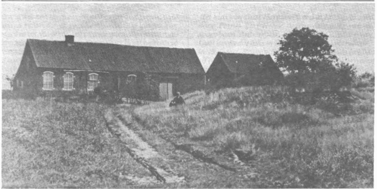
● Het molenhuis aan de Bevelsesteenweg, nu als restaurant gebruikt.