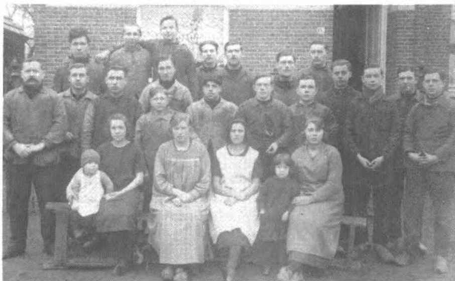
Een "fabrik" van Nijlense diamantbewerders (begin van deze eeuw), compleet met supporters.