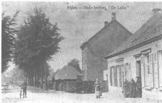
De aloude herberg "De Lelie" aan de Bouwel-sesteenweg, een alweer verdwenen dorpsgezicht.