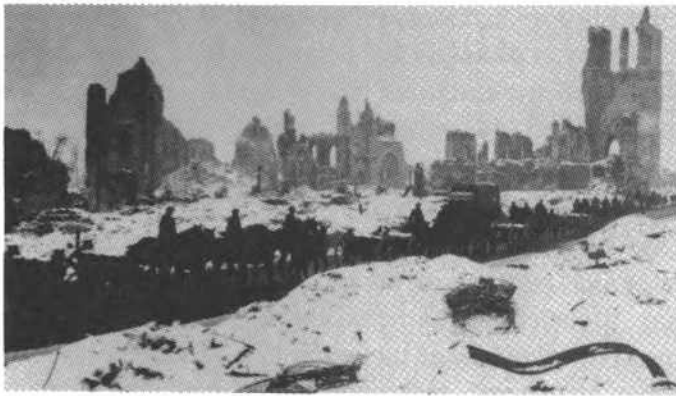
Artillerie in het stukgeschoten Ieper (1917)

Ze hebben dan, hij was nog maar pas zeventien jaar, een ruwhouten kist gemaakt en hem begraven langs de kasseiweg van Nieuwpoort naar Oostduinkerke - dorp , tegenover het driehoekig bos. Ik heb dat later met eigen ogen gezien. Na de oorlog hebben ze het stoffelijk overschot overgebracht naar Emblem. Er is dan een schoon mis geweest met drie heren en mooi gezongen, maar... ja."