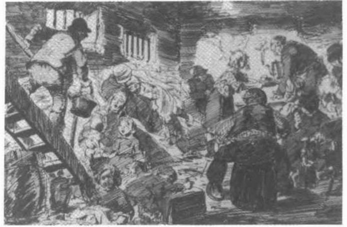
Vlaamse vluchtelingen te Sluis (1914) Tekening Alfred Ost