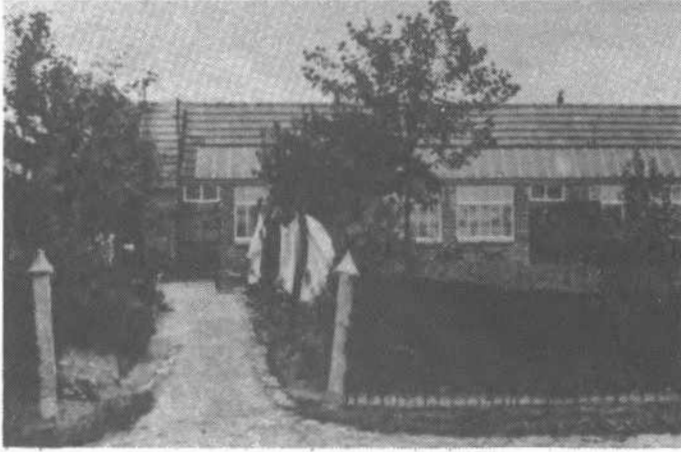
«Een slijperij in de Kempen, gelegen langs de baan Lier - Herenthals.» Zitten we in Nijlen?

In onze vorige "Poempen" schreven we dat er tot het begin van de Tweede Wereldoorlog te Nijlen ± 70 grote, middelgrote en kleine slijperijen gebouwd werden. Daarvan: