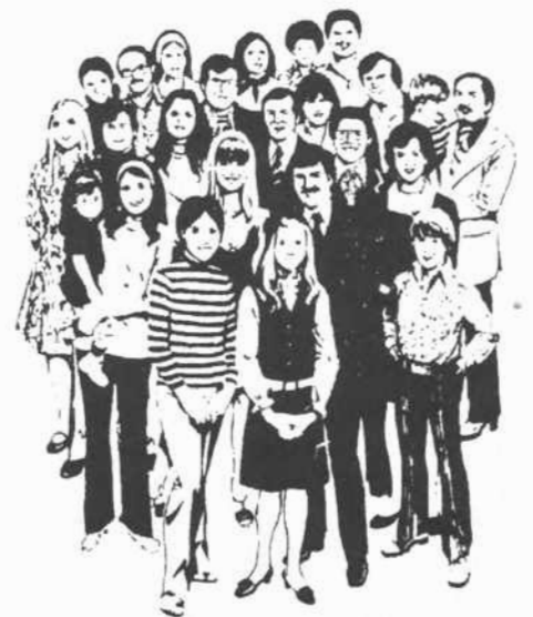
Mensen van bij ons