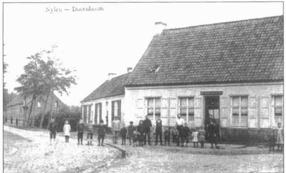
Nijlen - Doornboom

Aan de linkerkant van "Den Doornboom" bemerkt u twee kleine witte huisjes. In één van deze huisjes leefde en werkte Charel Van Hoof, één van de eerste Nijlense schijvenschuurders (zie de reeks "Diamant een schitterend verhaal").