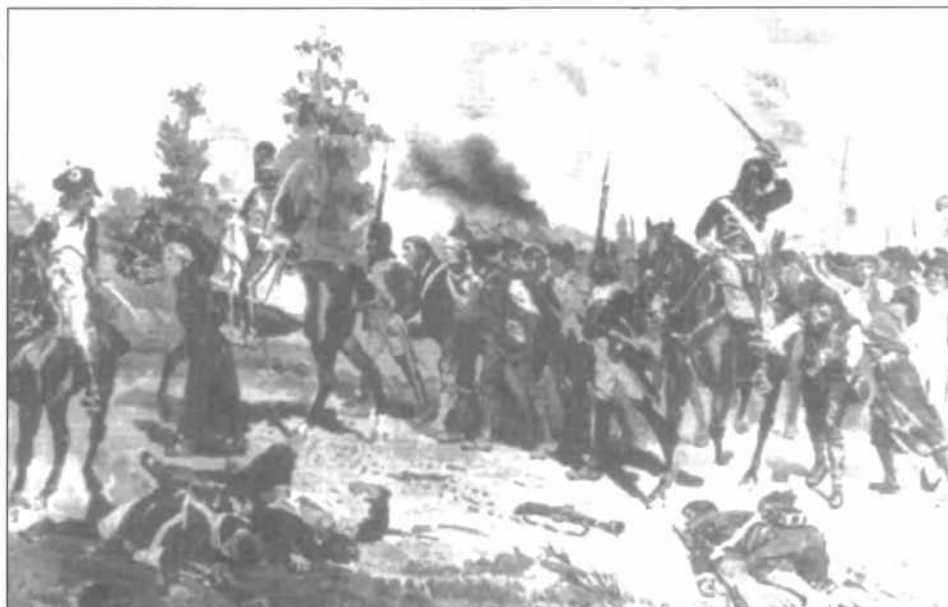
De Zuidelijke Nederlanden door Frans geweld overspoeld. Twintig jaar lang zal ook Nijlen leven in de schaduw van Frankrijk.

Schepen De Cnaep tekent op dat men nieuwigheden zag die iedereen met verstomming sloegen. De volgende jaren waren geen zier beter. De ongemeen strenge win-