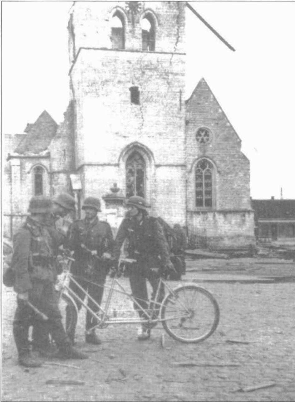
Duitse soldaten voor onze door de Belgische genie opgeblazen kerktoren in mei 1940