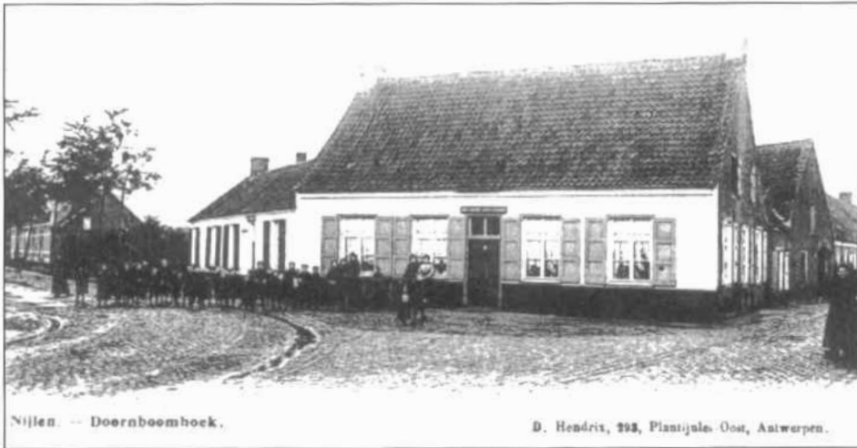
Nijlen. -- Doornboomhoek.

Hierbij vindt u enkele van de talrijke mooie foto's in ons fotoalbum. Zij tonen hoe ons allerliefste Nijlen vroeger was. Ongetwijfeld borrelen bij het zien van deze foto's bij de generatie die het zo nog heeft geweten, herinneringen op. Wellicht ook een tikkeltje heimwee. Als deze foto's konden spreken, zouden wij zonder twijfel nog boeiende en misschien zelfs historisch belangrijke gebeurtenissen te horen krijgen.