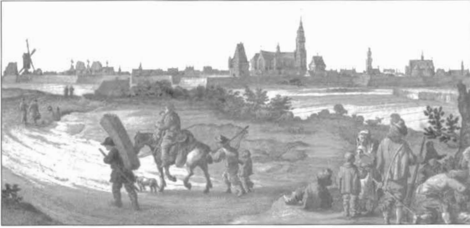
Stadsprofiel van Lier in 16de eeuw, gezien vanuit het noordwesten