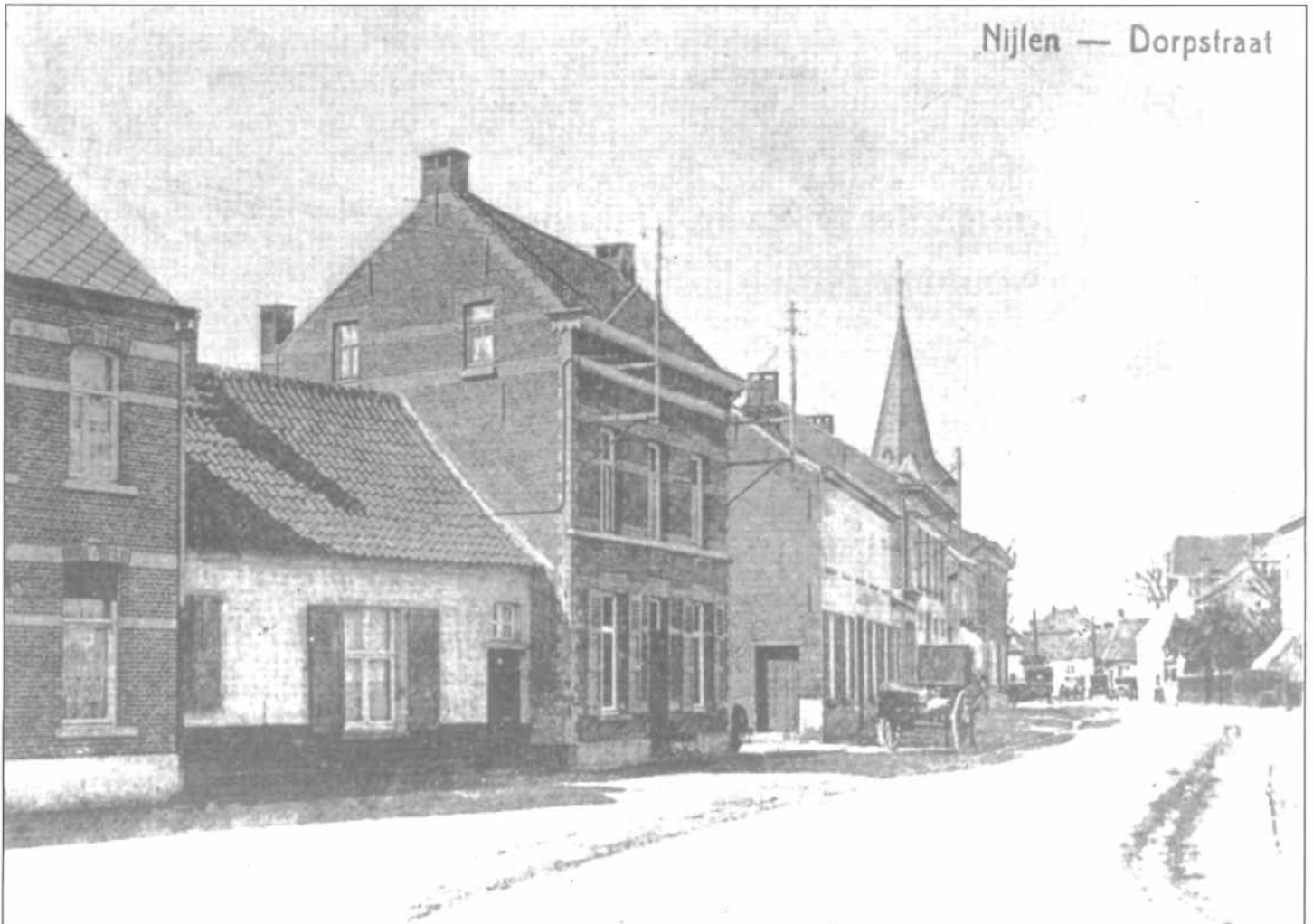
Nijlen — Dorpstraat

TIJDSCHRIFT HEEMKRING DAVIDSFONDS NIJLEN NUMMER 33 - 34 □ ZOMER1998 □ AK 2560 NIJLEN