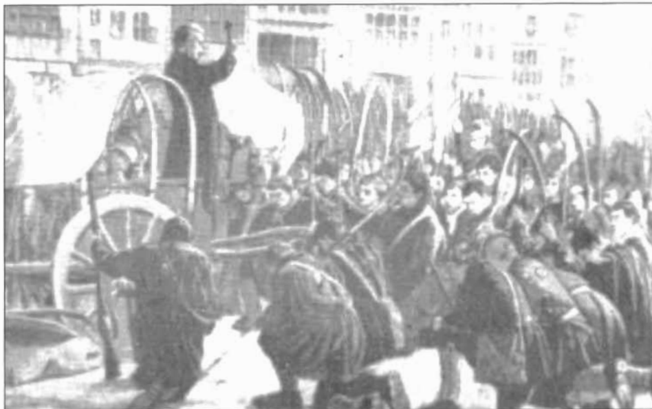
De boeren kwamen in opstand tegen de antiklerikale Fransen.