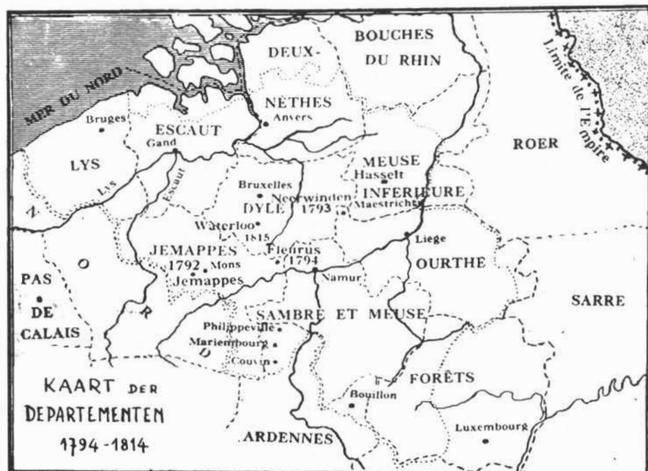
De negen departementen onder Napoleon

Pastoor De Cock werd later naar de citadel van Antwerpen gebracht waar hij opgesloten bleef tot 31 juli. Hij moet een taai en vindingrijk man geweest zijn, want hij ontsnapte uit de citadel en vluchtte naar Holland. Hij verbleef er tot 15 maart 1800.