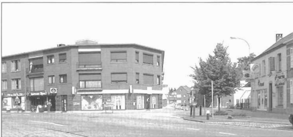
Den Doornboom, anno 1998!