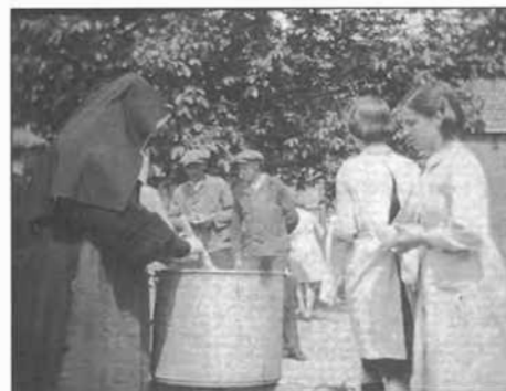
Deze foto toont de dagelijkse bedeling van lekkere soep, waarschijnlijk naar de school gebracht door twee gemeentewerklieden. Wegens de tijdens de oorlog heersende voedselschaarste was de overheid terecht bezorgd over de gezondheid van de jeugd, vandaar deze maatregel. De soep werd bereid in het voormalige café "Den Doornboom" (nu BBL) door enkele vrouwen onder leiding van Amelia Davidson. Ze deed dat in dienst van het gemeentelijke "Winterhulpcomité".

Toen na de 18-daagse Veldtocht het Belgisch leger de strijd staakte en zich overgaf aan de Duitse overmacht, nam onmiddellijk daarna het Duitse bewind de maatregelen over die de gevluchte Belgische regering had uitgewerkt in verband met de