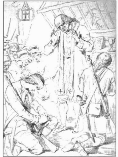
Illustratie uit "De Boerenkrijg", roman van Hendrik Conscience.

Ook te Lier kende de Boerenkrijg heel wat aanhangers.