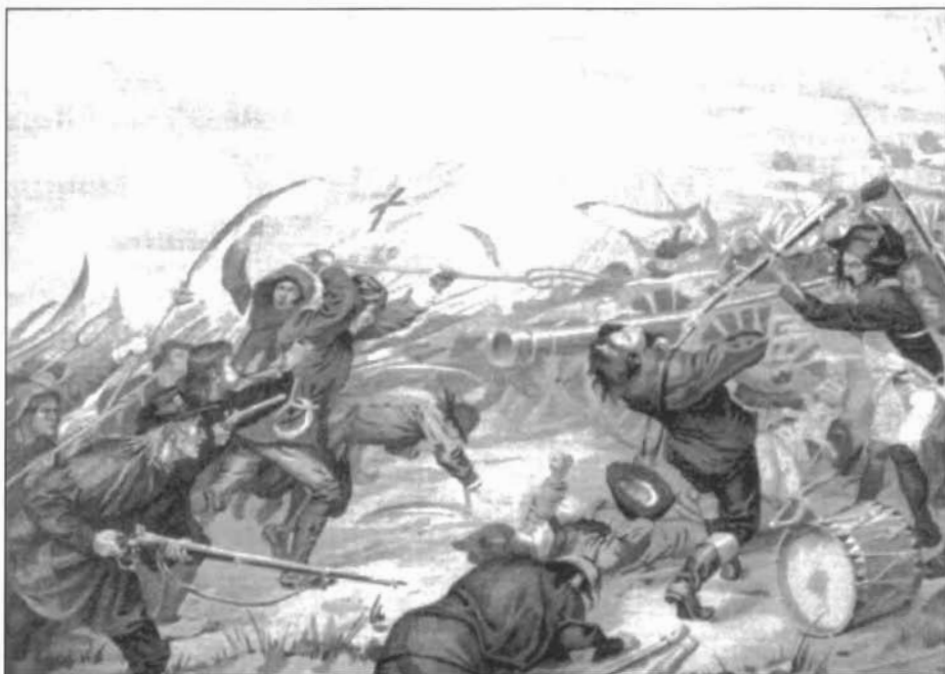
Herdenkingsplaat van het Davidsfonds (1898)

De grieven van de plattelandsbevolking die tot de opstand aanleiding gaven, hebben we reeds in vorig nummer besproken. Toen op 25 september 1798 de wet op de verplichte legerdienst, de gehate conscriptie, openbaar werd afgekondigd, was de maat vol. Concreet betekende deze maatregel dat alle mannen tussen 20 en 25 jaar onder dwang moesten deelnemen aan de onderdrukking van het eigen volk of een ander volk.