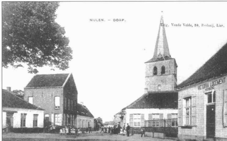
Boven: De Roskam en de "Dorpplaats" in het begin van deze eeuw. Onder: De huidige, "Nieuwe Roskam" aan een overdruk kruispunt.