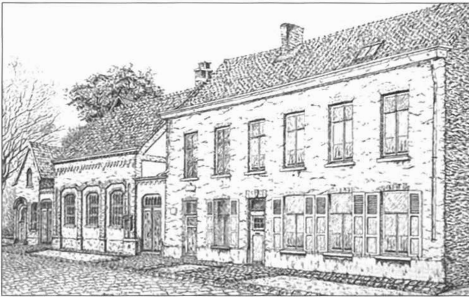
Op deze pentekening van Paul Geefs zien we, vlnr, de oude bibliotheek van Bevel (tot 1940 in gebruik), de oude school (eerste dubbele deur), "den bak" (tweede dubbele deur), het vroegere gemeentehuis (gesitueerd achter drie ramen op de verdieping) en tenslotte het "schoolhuis" (geboortehuis van Meester Ward Op de Beeck).

lessenaar. De meeste leerlingen bezaten een houten schrijfbak voor hun lei, griffels... Ze hielden het bakje op hun knieën en legden er hun lei op om te schrijven. De ouderen herinneren zich nog wel deze rechthoekige dondergrijze natuurleien in een houten kader. Men schreef er op met een dunne griffel. Ieder kind had een lei van ongeveer 30 bij 20 cm. Ze was aan beide zijden beschrijfbaar. En wat als de lei vol was? Heel eenvoudig. De meeste kinderen hadden een sponsdoosje. Met het sponsje werd het overbodige weg gevaagd. Heel gemakkelijk voor de meester : die moest 's avonds geen werken verbeteren. Had men geen sponsje, of was het droog! Geen paniek! Vlwg wat speeksel op de lei, en wrijven met de mouw. Deze werkwijze werd tot na 1950 gebruikt.