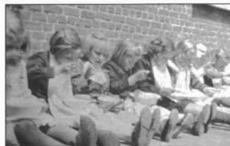
Soeplepelende leerlingen in de Zusterschool, Nonnenstraat, tijdens de oorlogsjaren.

Al vanaf 12 mei 1940 was het verboden aan hotels, restaurants, herbergen, kantines, kortom inrichtingen waar tegen betaling maaltijden aan het publiek werden verschaft, méér