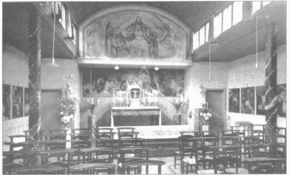
De kapel in het rusthuis (1937)

nemer Driesen (de zoon van Charel Driesen), in de tuin aan de zonnekant, nogmaals twee panden bijgebouwd, waardoor er extra kamers beschikbaar kwamen op de 1ste verdieping en de zusters, die tot dan toe in alkoven geslapen hadden, nu elk een afzonderlijke kamer konden betrekken. De gelijkvloers bijgekomen ruimten werden respectievelijk uitgerust als eetzaal met afzonderlijke tafeltjes en als een leefruimte met ruststoelen.