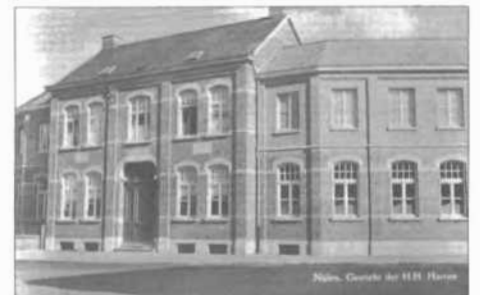
Het "nief gesticht" midden vorige eeuw.

ken ministeries. Bijgevolg moest dringend gedacht worden aan de oprichting van een volledig nieuw rusthuis. Daar dit onmogelijk was op de bestaande locatie Statiestraat 13, werd in 1983 het vroegere voetbalveld gelegen Kerkeblokken en eigendom van de familie Pouppez de Kettenis de Hollaeken aangekocht. Zodra dit gebeurd was, begon men met de bouw van het huidige rusthuis, dat in 1992 kon betrokken worden.