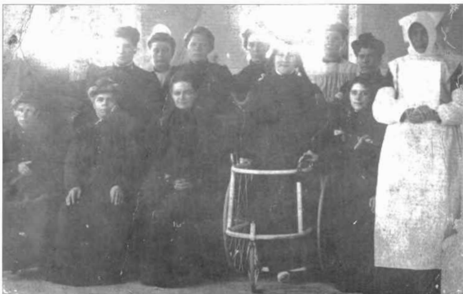
Een merkwaardige foto van de bewoners van ons allereerste gesticht aan de Gemeentestraat (begin vorige eeuw)

Zoals we in Poemp 37 lezen konden, maakten de fors in aantal stijgende verzoeken tot opname in het Gesticht der Heilige Harten een dringende expansie van het rusthuis meer dan noodzakelijk.