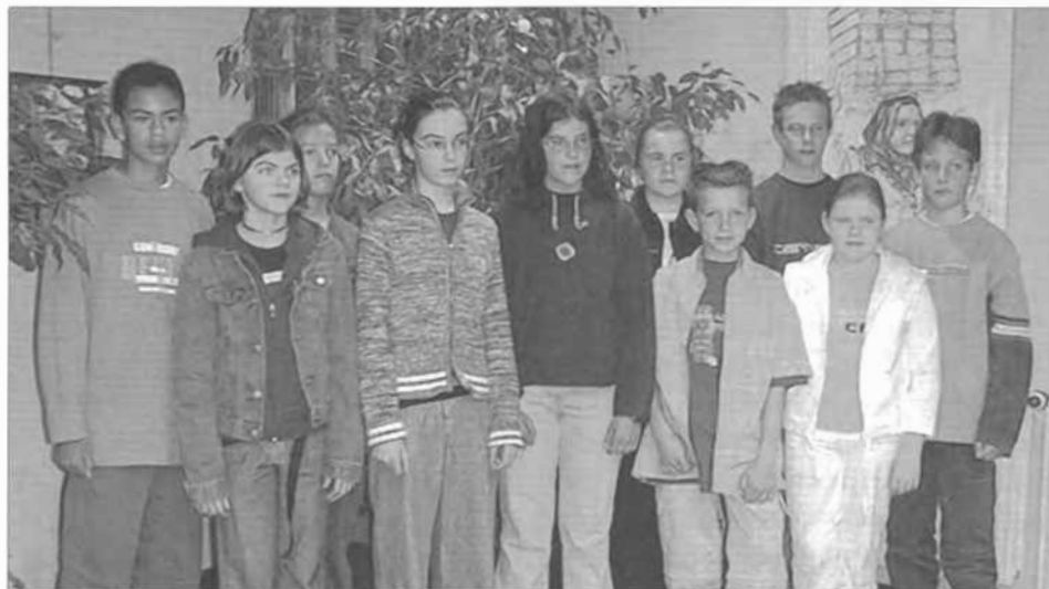
De Junior Journalisten 2002