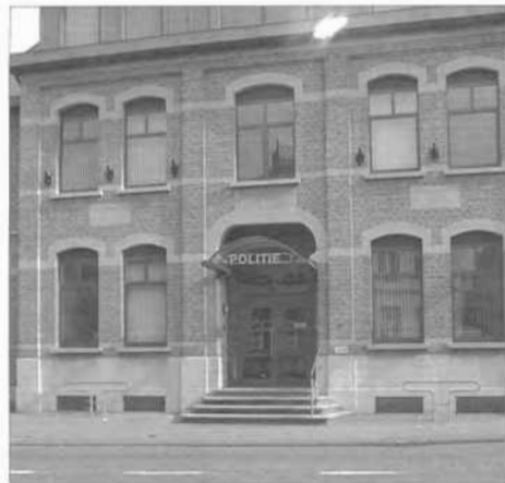
Het "nief gesticht" werd einde vorige eeuw door het gemeentebestuur volledig opgeknaapt. Onder meer de politie vindt er nu een prima onderkomen.