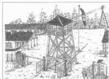
Hoofdingang van het kamp Stalag I

In de kampen en op de "Arbeitsplatz" kregen de gevangenen een kleine vergoeding voor het werk dat ze er deden. Het was "Lagergeld" ofte kampgeld, dat daar alleen geldig was voor de aankoop van sigaretten en andere kleinigheden.