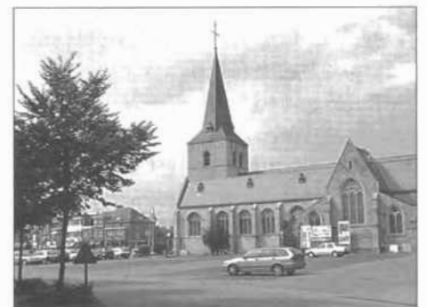
Het kerkplein anno 2002.