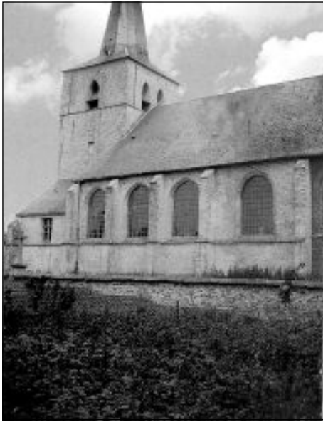
Op deze foto uit de 19de eeuw zien we de kerk na de vergroting van 1840 langs de zuidzijde (zijde kerkplein).

vergroting. Meteen begon een zoektocht naar een betaalbaar plan, want blijkbaar zat Nijlen met zijn arme zandboerkens toen niet zo goed bij kas. Berckmans stelde voor de kerk gewoon oostwaarts te verlengen met twee traveeën of ongeveer 7 m, plus een nieuw koor. Hij raamde de verbouwing op 19.171,64 oude franken. Het metselwerk zou uitgevoerd worden in baksteen, het tongewelf in hout, het stukadoorwerk in drie lagen, waarvan de laatste in het wit.