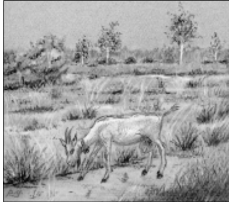
Het Hollands Kamp (tekening Paul Geefs).

De woeste en onbebouwde streek met wat schaarhout, paddevarens en heideplekken werd af en toe door enkele keuterboerkens benut om er wat buntgras en heide te hakken voor winterbeschut en er biekorven te plaatsen. Ze lieten rond hun schamele hutten hun geiten weiden. Groot vee konden ze er niet houden, omdat de natuur hen niet veel kans bood. In het vroege najaar, de geitentijd, was er steeds wel een bok om de ritse geiten te “springen”... zodat het geitenbestand op peil bleef. Af en toe werd er ook wel wat wild gestroopt, want van echte landbouw was er geen sprake. Hout werd gekapt en de wind deed het landschap verkotten. Tussen de Schooldijk, de Varkensdijk, de Halfwegendreef en de Heikant bleef slechts erge armoede over, nadat de legerbenden met vele zware beproevingen en gehate soldateske uitpattingen de bevolking geteisterd hadden.