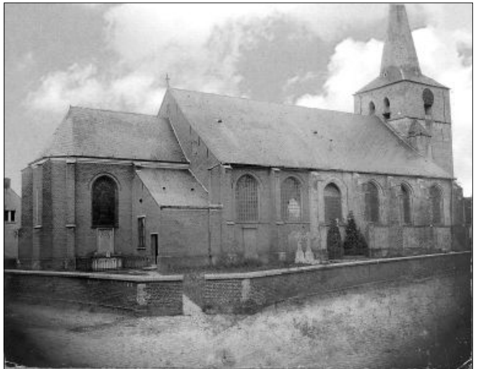
Deze derde foto uit de 19de eeuw toont de kerk na de verbouwing van 1840 langs de noordzijde (huidige Gemeentestraat).

Hierop stelde architect Berckmans voor aan de gemeente om zelf de bouwmaterialen aan te kopen en dan de verschillende werken apart toe te wijzen. Op 23 april 1838 volgde het gemeentebestuur deze denkpiste. Men zou de werken “par économie” of in daghuur laten uitvoeren. Men koos hierbij voor een doorlopend, eenvoudig zadeldak. Het materiaal zou door de gemeente gekocht worden en de bevolking zou wel inspringen om het vervoer te doen. Aldus gebeurde! In mei werd beslist de bouwmaterialen nog dat jaar aan te kopen en de werken te starten in 1839. Steeds maar op zoek naar besparingen werd verder beslist het nieuwe koor en de sacristie in het