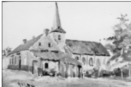
Het schilderijtje uit de 19de eeuw.

Waarschijnlijk was het Sint-Willibrorduskerkje dat op het einde van de 16de eeuw grondig verwoest werd, het eerste Nijlense kerkje in duurzaam materiaal. In ons vorig nummer beschreven wij reeds hoe het gebouw in het begin van de 17de eeuw grondig hersteld werd, misschien zelfs wat verbouwd. Uit het plannetje van provinciaal architect Berckmans, dat waarschijnlijk dateert van 1837, kunnen we gelukkig ook een en ander aflezen over het oorspronkelijke stenen kerkgebouw (zie vorige Poemp). Door een gelukkig toeval ontdekten wij in Antwerpen bovendien een schilderijtje uit de 19de eeuw waarop onze kerk voor de eerste vergroting afgebeeld wordt. We zien dat de toren oorspronkelijk met drie zijden vrij stond en slechts aan één zijde het kerkship raakte. Het kerkje telde toen drie beuken, was ongeveer 14,25 m breed en iets meer dan 15 m lang. De buitenmuren werden gestut door tamen-