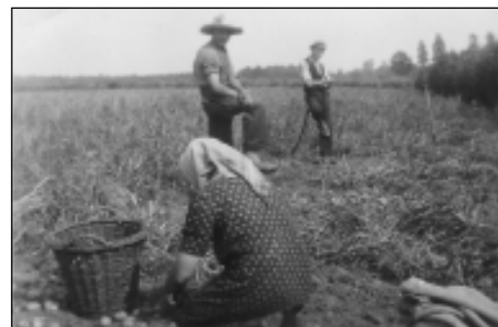
De aardappeloogst in 1948 op de Neerhoeve.