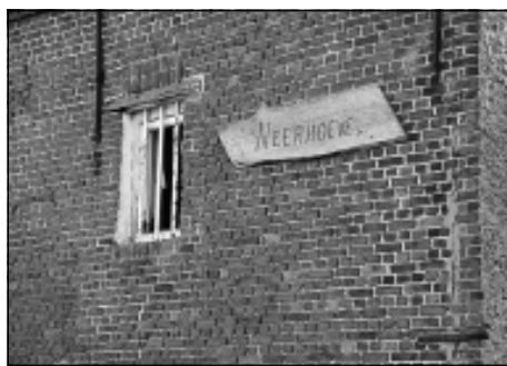
Verbergen deze oude stenen nog resten uit 1750?