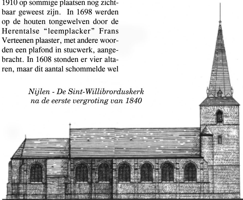
Nijlen - De Sint-Willibrorduskerk na de eerste vergroting van 1840