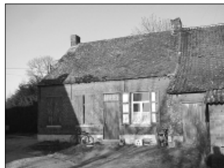
De Neerhoeve is anno 2003 duidelijk in verval. Zij zal afgebroken worden.

De handel heeft zich fel kunnen uitbreiden dankzij de diamantindustrie. De laatste jaren is er ook wat toerisme: natuurliefhebbers en kampeers uit de steden die de Antwerpse Kempen willen leren kennen.'