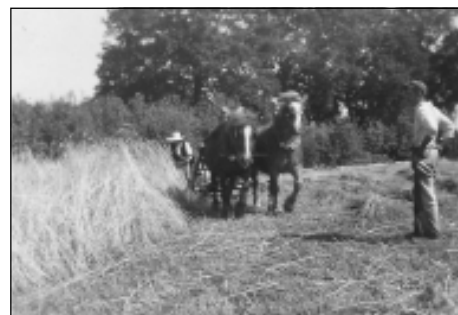
In 1949 zijn er te Nijlen nog 260 pachthoven waarop 700 personen werken. De foto toont de graanoogst op de hoeve Hens.