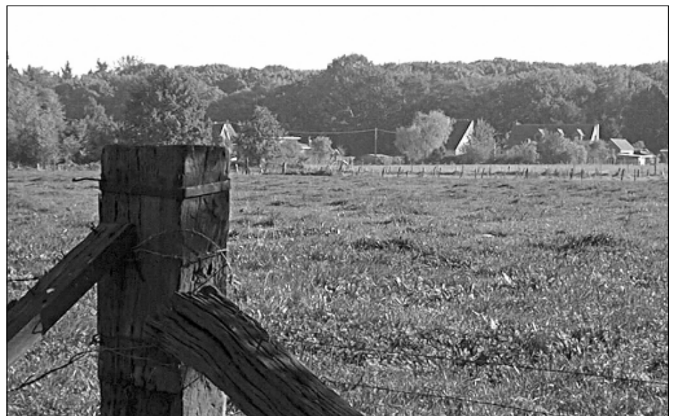
Het Hollands Kamp, anno 2003. Iets van de oorspronkelijke verlatenheid overleeft er nog!

Na de Vrede van Munster (1648), toen de Hollandse benden met hun plunderingen en brandstichtingen weggetrokken waren, kwam het normale leven stilaan terug. Door bemesting van de brakke grond, meestal wat stalmest en later af en toe ook wat kunstmest zoals guano, gaf die povere heidegrond dan toch nog wat opbrengst, meestal heikoren en voederbiet.