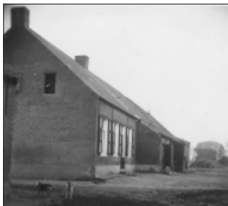
De Neerhoeve in 1949.