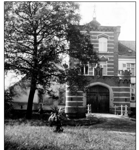
De monumentale poort, circa 1900