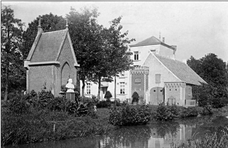
Het hofke, rond 1900, zuidzijde