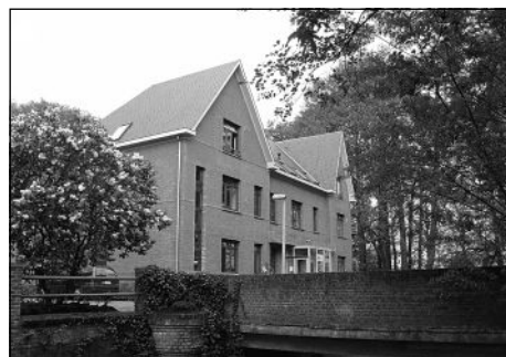
Tieboersschrans, anno 2004