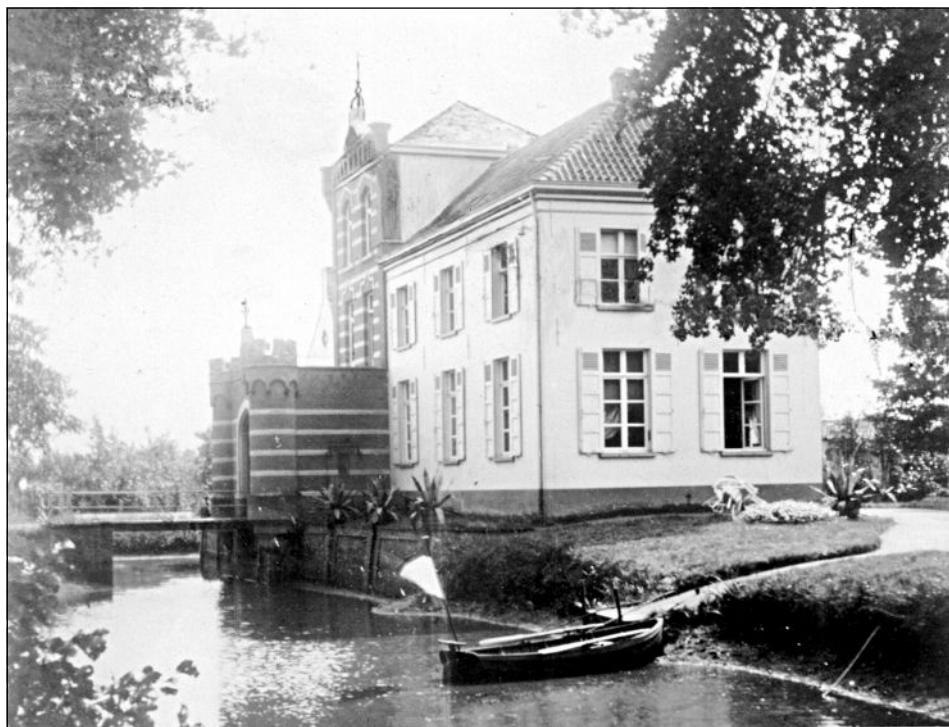
Tieboersschrans met monumentale ingangspoort, circa 1900.