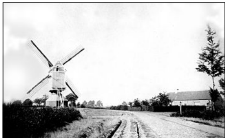
De in 1914 afgebrande houten molen aan het kruispunt van de Bevelsesteenweg met de Lege Baan.

Bij de terugkomst van de Nijlense vluchtelingen in oktober 1914 “werd bestatigd dat kerk, de houten en de twee steenen windmolens, vijf woningen en eene diamantslijperij door brand vernield en drij andere huizen door bommen beschadigd waren.”(*)