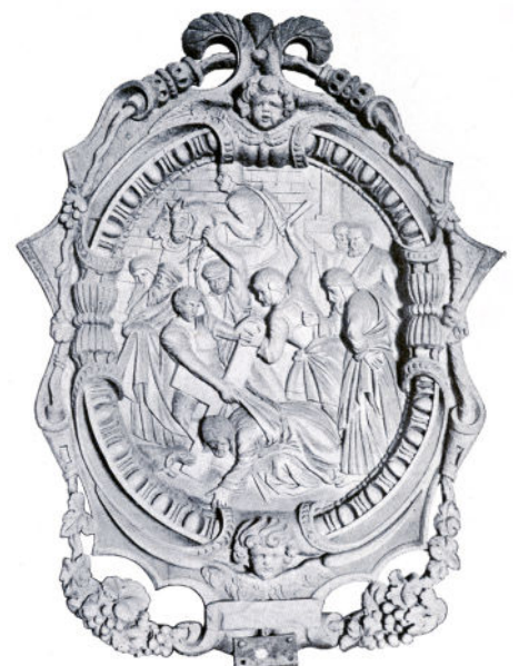
Ook de kruisweg verbrandde.

thoutschen steenweg het vuur op de kerk. Tweemaal werd, op de hoogte van het Belgisch vlag door de spil van den toren geschoten, een lange vuurstraal in de richting van Kessel-fort achterlatende. Rond 9 ure stond de gansche torenspil in laaie vlammen. Gansch de kerk, nog maar pas ten koste van meer dan 27.000fr. hersteld, vergroot en bemeubeld, werd de prooi van het vuur, onder andere: zeven geschilderde ramen, gestoelte, communiebank, preekstoel, vier biechtstoelen, muurbeschotten en kruisweg, alles in eik en kunstige stijl, benevens de sakristijmeubelen ook in wagenschot (rechtdradige, gladde dunne eiken planken) met koperen sloten, al de benodigdheden voor den dienst en de processie, het herstelde orgel, drij klokken en de horloge, alsmede de beelden: Ecce Homo, St.-Antonius en St.-Sebastianus."