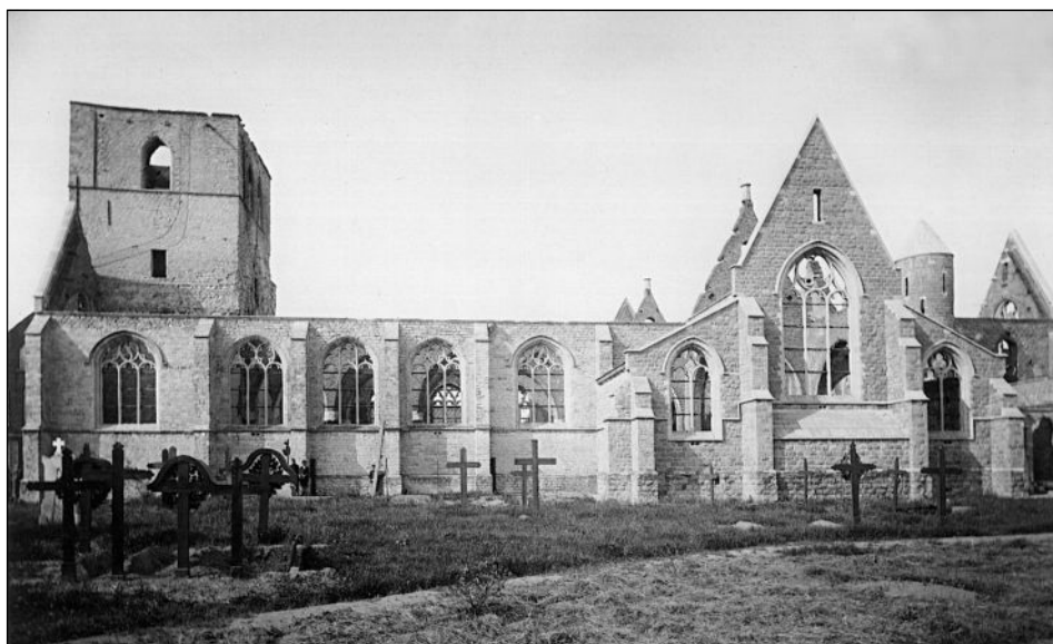
Oktober 1914 : "Gansch de kerk werd de prooi van het vuur!"

W e schrijven 1914. Op 28 juni wordt aartshertog Franz Ferdinand van Oostenrijk vermoord te Sarajevo. Op 28 juli verklaart Oostenrijk-Hongarije de oorlog aan Servië. Op 29 juli mobiliseert Rusland zijn leger, waarna Duitsland op 1 augustus aan Rusland de oorlog verklaart. Twee dagen later verklaart Duitsland ook aan Frankrijk, toen een bondgenoot van Rusland, de oorlog. Op 4 augustus 1914 valt Duitsland dan België binnen om Frankrijk aan te vallen. Engeland verklaart op zijn beurt de oorlog aan Duitsland. Gedurende heel de oorlog zou Nederland zijn neutraliteit kunnen bewaren. België daarentegen werd het slachtoffer van brutaal oorlogsgeweld, waarbij nieuwe wapens als vliegtuigen, machinegeweren, gifgas... ingezet werden.