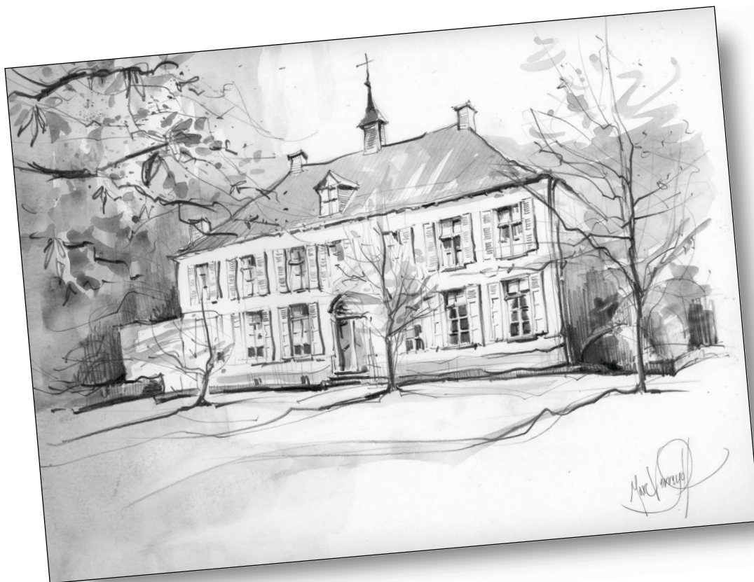
De pastorie van Nijlen in 2006, gezien vanuit een winterse tuin door Marc Verreydt.