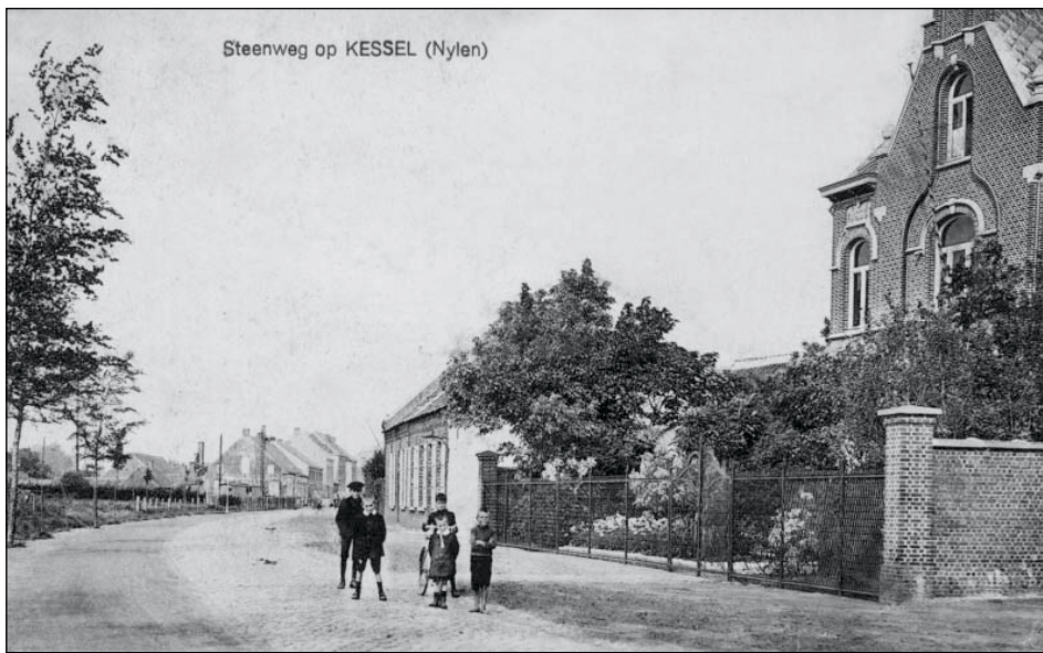
De Kesselsesteenweg, later gedeeltelijk J.E.Claeslaan geheten, in het begin van vorige eeuw. De rechterzijde, richting Lier, was nog een open ruimte.