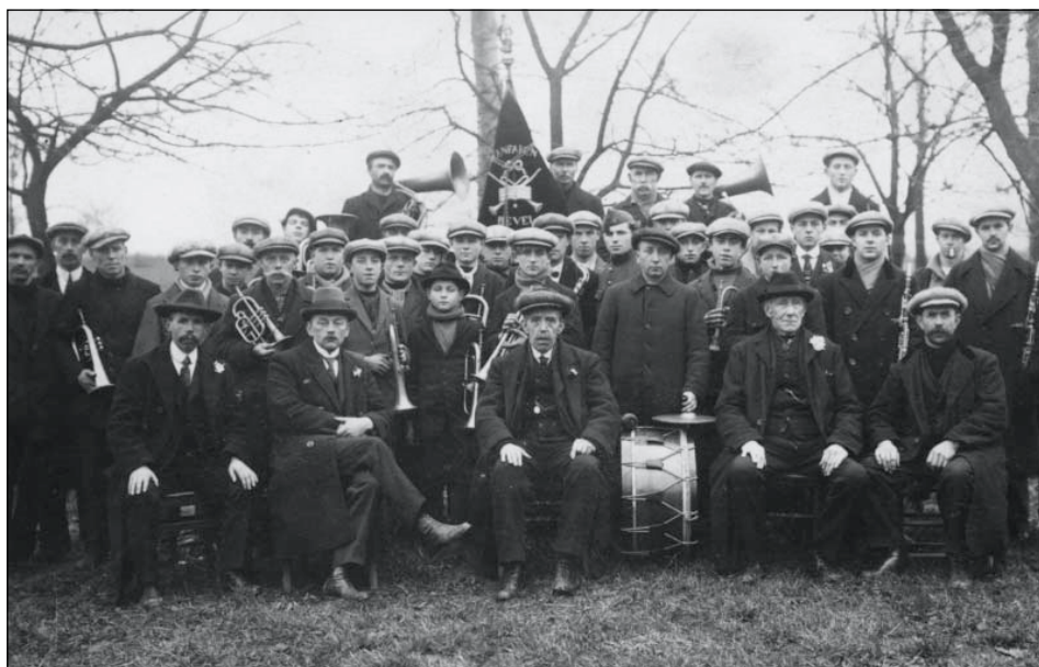
De Bevelse fanfare in een ver verleden. Wie herkent er nog iemand van?

Tijdens onze zoektocht naar de geschiedenis van Harmonie St.-Cecilia (gesticht in 1880) werden wij aangenaam verrast met de ontdekking dat er omstreeks 1865 – 1870 reeds muziekleven was in Bevel en in Kessel. Een en ander inspireerde ons tot het schrijven van een kort overzicht van de muziekmaatschappijen in onze gemeente.