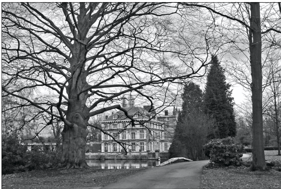
De machtige beuk aan de ingang van het kasteeldomein de Bist te Kessel.

In Kessel staan in het domein van het kasteel de Bist een aantal merkwaardige bomen, zoals een prachtige tulpenboom en een machtige beuk juist voor de brug die toegang geeft tot het hof. Een gedeelte van de vroegere dreef naar het kasteel bleef ondanks de verkaveling bewaard en bestaat uit oude wilgen. Langs de vijver groeit zwarte els als boom, wat vrij uitzonderlijk is. In het park staan o.a. ook nog drie mammoetbomen, een mahonieboom, enz..