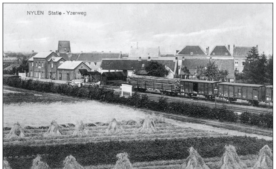
Het eerste station van Nijlen, eveneens in het begin van vorige eeuw. Achteraan zien we de molen Dom. Naast de Spoorweglei lag zowaar nog een graanveld! Pas na de Eerste Wereldoorlog ging Nijlen echt groeien.