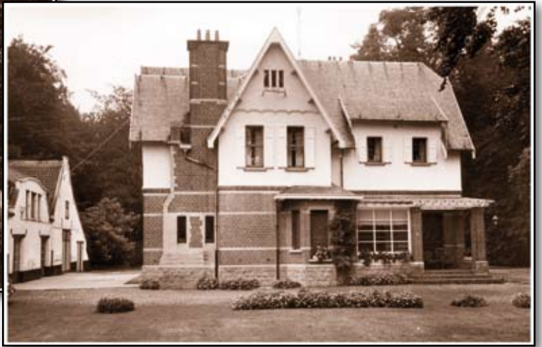
< "Kasteel" Torenven op een oude postkaart

D e route die José de Ceulaer beschreef, bestond uit onverharde wegen, zandbanen, die dwars door de eenzame, donkere Kesselheide, - tijdens de Tweede Wereldoorlog nog een groot dennebos -, naar Kloosterheide liepen, via de Lindekensbaan en de Torenvenstraat. Die laatste was toen nog grotendeels een mooie beukendreef. Rechts ervan, richting Lier in een park- en bosgebied, stond het kasteel Torenven, nu villa Torenven.