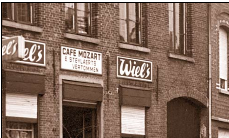
Een vroege klompenmaker in de muzikale familie Steylaerts werd in 1805 te Broechem geboren. Voor de Nijlense tak moeten wij wachten tot 1923, toen de Fé het Brouwershuis (foto) kocht. Daarover meer in volgend nummer!

Een krantenartikel uit 1967 onder de titel “geen klompenmakerij meer te Nijlen” kondigde het einde aan van het eens zo onmisbare ambacht in onze gemeente. Het opsporen van