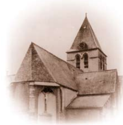
De oude kerk van Bevel werd in 1940 gedynamiteerd en met de grond gelijk-gemaakt...

wanneer een dorp, dorp is. Hiervoor bestaat geen nauwkeurige bepaling! Het is alleszins een bewoonde plaats, en dus een nederzetting volgens Wikipedia, de vrije encyclopedie. Nederzettingen kunnen in volgorde van toenemende grootte ingedeeld worden in gaten, buurtschappen, gehuchten, dorpen, vlekken (verouderde naam), steden, agglomeraties, metropolen. Waar liggen de grenzen dan? Steeds volgens dezelfde encyclopedie bezit een dorp een eigen kerkgebouw, is (in vroegere tijden?) afhankelijk van landbouwactiviteiten, heeft open grenzen, is verweven met het landelijke gebied eromheen, vormt een hechte gemeenschap. Een verdienstelijke poging om het begrip "dorp" af te lijnen, maar niet rotsvast. Wij zouden met deze omschrijving bijvoorbeeld het Nijlense gebied "van