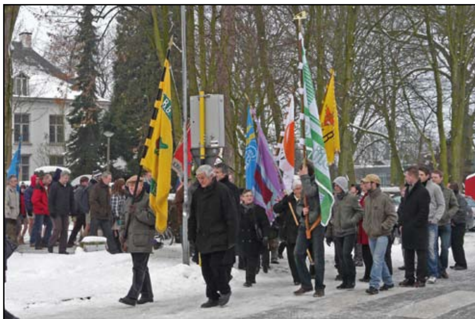
Met harmonie en vlaggendragers voorop ging het naar de St.-Willibrorduskerk.

Traditiegetrouw werd de pastoor door een afvaardiging van gemeenteraad, schepencollege en parochiale verenigingen afgehaald aan de historische pastorie.>