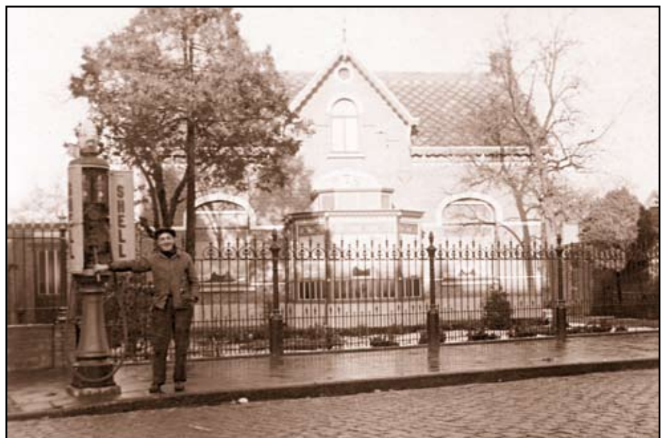
Soewe Pinder bij zijn "naftpoemp". Op de achtergrond de villa van Clothilde.