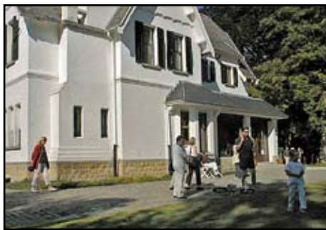
Torenven, Open Monumentendag 2003