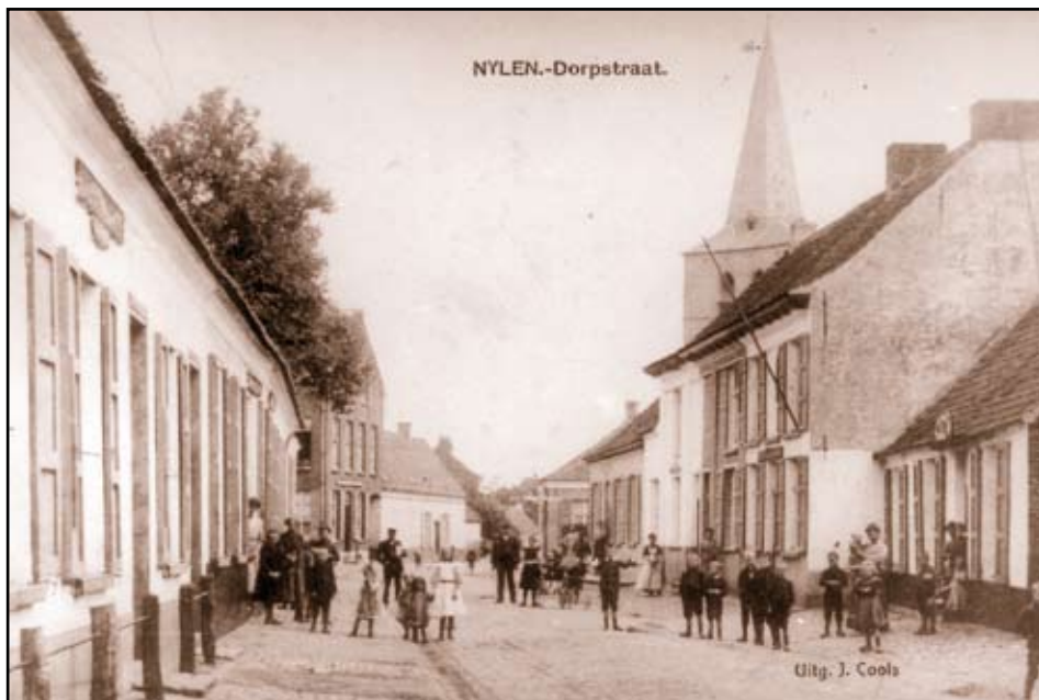
De Nijlense Statiestraat of "de Dorpstraat" met een klad volk, begin 20ste eeuw.