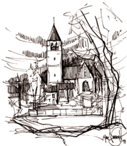
De Kesselse Lambertuskerk op een pentekening van Marc Verreydt.

Wanneer de eerste kerken in onze dorpen gebouwd werden, zal een vraagteken blijven. Men mag er wel van uitgaan dat er in Bevel, Kessel en Nijlen al minstens 800 jaar een kerk staat. Dit kan men afleiden uit het feit dat bij de oprichting van de