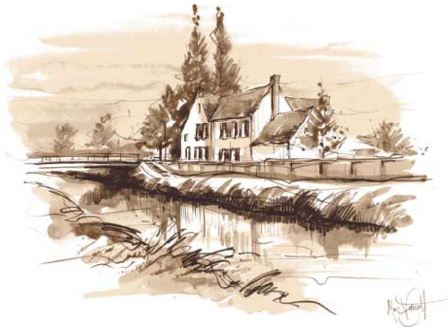
De Grote Nete aan de Hullebrug (tekening Marc Verreydt)

Beelden uit mijn kinderjaren Ut mijn jeugd zo vrij en blij Trekken somtijds kalm en rustig Aan mijn peinzend oog voorbij Ik denk nog dikwijls aan die dagen Van geluk en stille vree