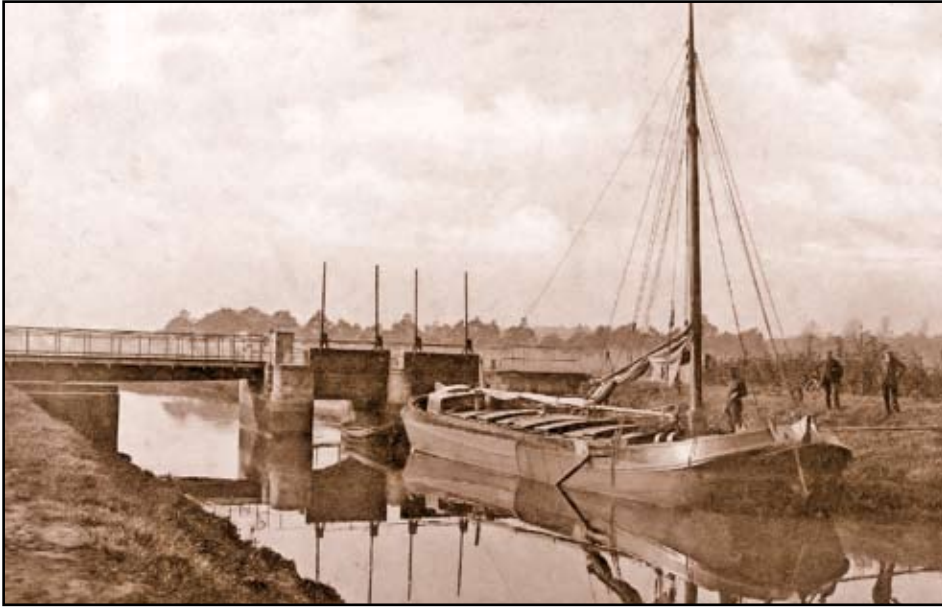
Vrachtschip bij de oude brug aan de Boekt te Gestel.