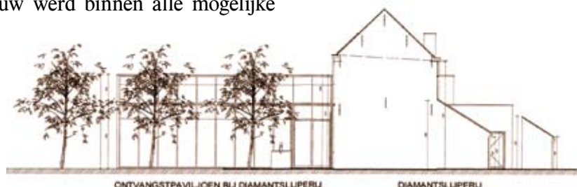
ONTVANGSTPAVILJOEN BIJ DIAMANTSLIJPERIJ