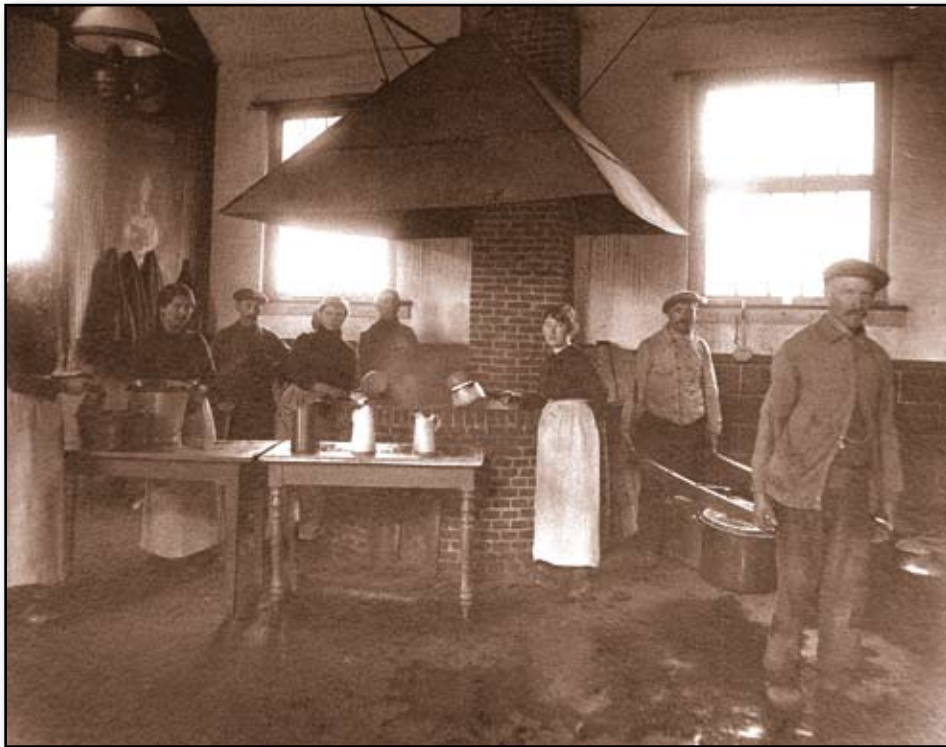
Het lokaal van het Nijlense Hulp- en Voedingscomiteit, circa 1915. Wie weet waar het precies gelegen was?! (Foto Rijksarchief Antwerpen).

Begin augustus 1914 vielen Duitse troepen België binnen om aartsrivaal Frankrijk te kunnen aanvallen langs de kortste weg. België had het ultimatum om vrije doorgang geweigerd, omdat het neutraal wilde blijven.