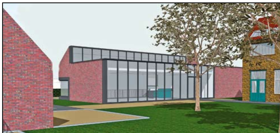
Werktekening van het ontvangstpaviljoen bij Slijperij Lieckens.

NUMMER 73 □ 01-02-03/2012 □ P309458 □ AK 2560 NIJLEN1