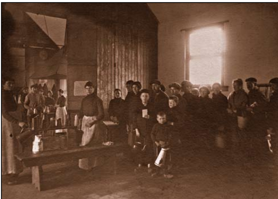
Het lokaal van het Nijlense Hulp- en Voedingscomité, circa 1915.

Bevolking : 3.500 en 90 vluchtelingen uit Kessel, die niets hebben. Nijlen telt :