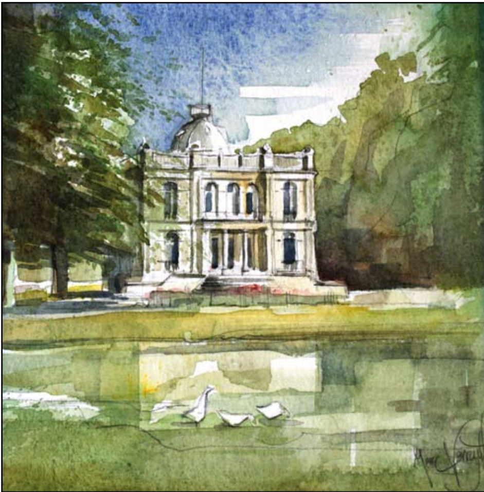
Kesselhof - Aquarel Marc Verreydt.

dende toestel, nl. de radio-operator R.V.C. Witham en K.A.M. Stuart, de 'bombardier' of bommenrichter, de man die de bommen op het doel moest richten.