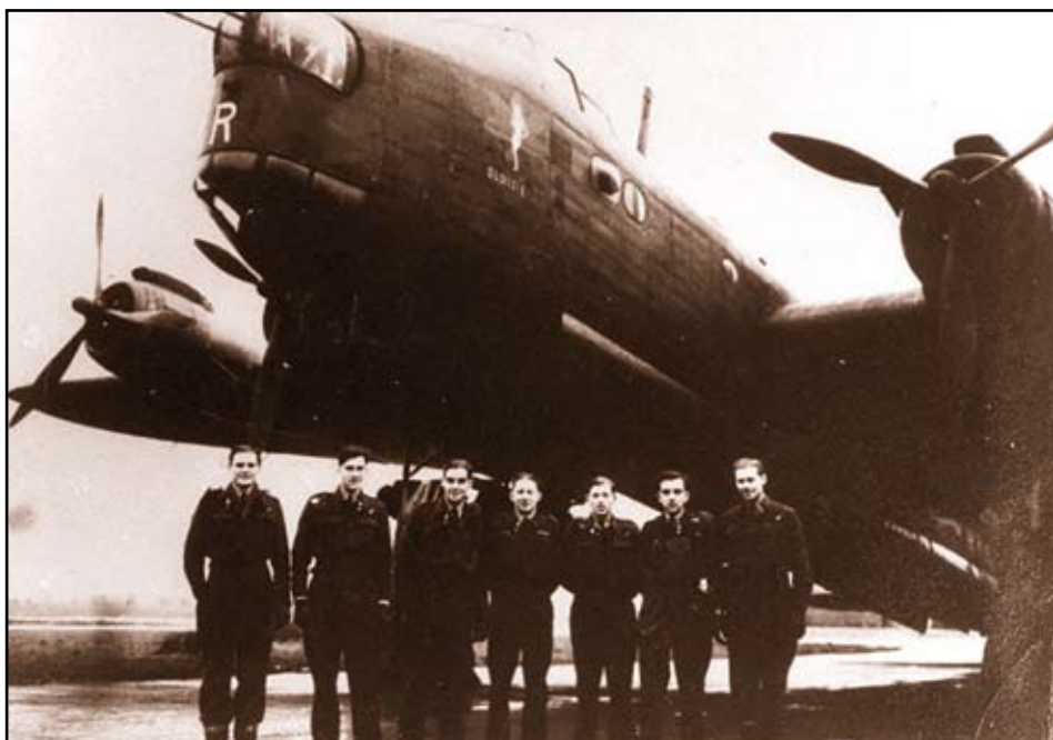
Bommenwerper Lancaster 737 met zevenkoppige bemanning.

Twee mannen geraakten, voor de crash, toch nog levend uit het bran-