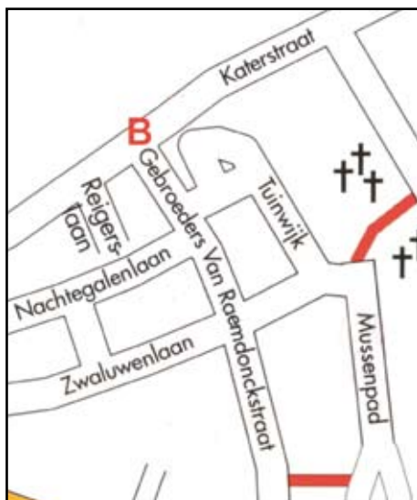
Op dit plan duidt de rode B de ligging aan van de verdwenen boerderij van Peerke Van Gansen.

De pachtboerderij van Peerke was een gemengd bedrijf, met graan en vee. De landerijen strekten zich uit over de huidige Tuinwijk, plus een stuk op de Bist, ter hoogte van het zuiveringsstation. Alles goed voor ongeveer 5 ha. Over de Nete werden er ook gronden gepacht "van de kerk" met een oppervlakte van zo'n 2 ha, aldus Louis en Marie. Aanvankelijk telde het kleine bedrijf