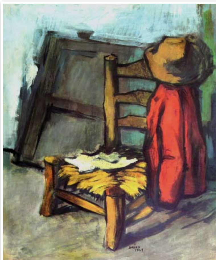
Dries Van den Broeck - "Thuis" - 1941