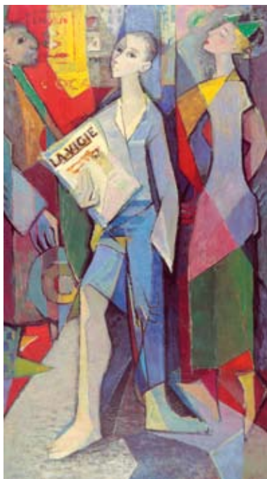
Illustratie uit folder "Dries 70" Leuven oktober 1993