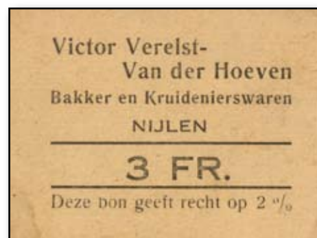
Een kortingbon uit de oude tijd.

klant de winkel binnenkwam. Tot ergernis van de winkelier en tot pret van de jeugd was bellekentrek een vaak toegepast spel. De winkelier ontving van de grossier of groothandel de artikelen in grootverpakking of bulk. Weinig artikelen waren in kleine verpakking te krijgen. Suiker werd meestal geleverd in papieren zakken, droge erwten en bonen in jutezakken, snoep en koekjes in dozen, bokalen en potten, zout, siroop en bruin zeep in vaatjes. Het snoepaanbod was tijdens de oorlogsjaren en ook later nog eerder beperkt. De voornaamste snoepjes waren suikerstekken in alle kleuren, zakjes zuurpoeder, kalissenhout (zoethout), kalissensap (drop), (wie kent het nog?) en van alle tijden, "oep zen nales", sikskes en babbeleirs. De winkelier sneed af of woog af wat je nodig had; alles wat je meenam passeerde de weegschaal en de toonbank. Wie gedacht had dat de hedendaagse supermarkten het uitreiken van kortingsbonnen voor een volgende aankoop hadden uitgevonden vergist zich. Buurtwinkels maakten al gebruik van dit concurrentiesysteem. Menig winkelier had het zeer moeilijk tijdens de oorlogsjaren: hij stond in voor de verdeling van het schaars aangevoerde voedsel. Gezien zijn vaak persoonlijke relatie met zijn klanten en omdat hij hun financiële situatie kende, stond hij dikwijls voor moeilijke keuzes.