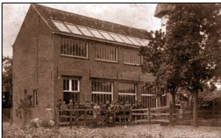
Slijperij Lieckens, begin 20ste eeuw.

NUMMER 77 □ 01-02-03/2013 □ P309458 □ AK 2560 NIJLEN1