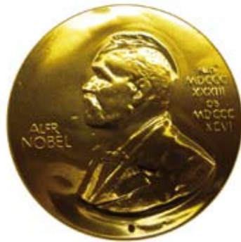
Medaille Alfred Nobel

In het begin van de 20ste eeuw waren er in Europa zes grote machtsblokken: Groot-Brittannië, Frankrijk, Duitsland, Oostenrijk-Hongarije, Rusland en het Ottomaanse rijk. De bestaande vrede was het resultaat van een broos machtsevenwicht tussen deze staten. Elk van hen was zich bewust van dit wankel evenwicht en deed daarom gretig mee aan een ongeziene wapen-