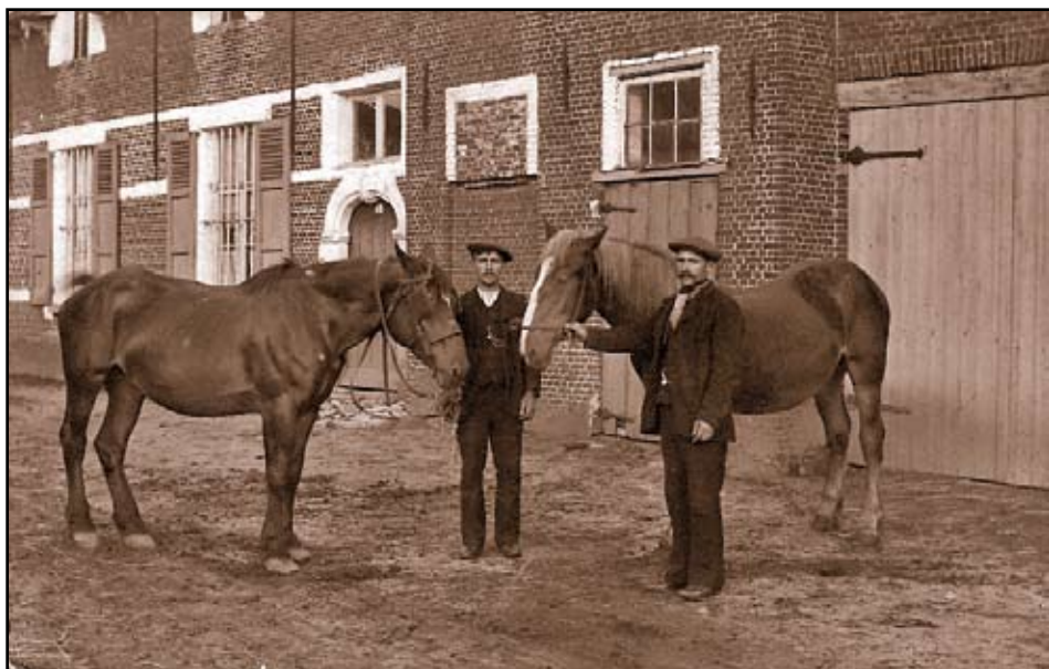
Paarden op het erf van het Goed ter Clusen (1914 - 1918)

Een cluse of kluis wordt verklaard als kluis, kluzenaarshut, monnikshuis of iedere afgesloten ruimte. Twee percelen, die achter de voormalige hoeve lagen, werden de grote en de kleine Cluse genoemd. Deze velden liggen duidelijk aan de oorsprong van de hoevenaam. Ze waren op de een of andere manier rondom afgesloten door grachten of houtgewas. Ook de gebouwen en het winland lagen in één blok ingesloten tussen de Grote Nete, de Zak- en de Klokkewielstraat. Dat het iets met kluzenaarswoningen te maken heeft, is uitgesloten.