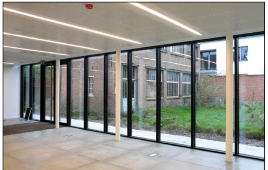
Het nieuwe ontvangstgebouw wacht nu op de restauratie van Slijperij Lieckens.