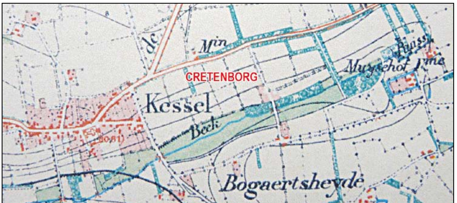
Een stukje Kessel op de militaire kaart "Lierre" (opgenomen in 1865, gedrukt in 1884). "Cretenborg" werd door de redactie aangebracht.

In Kessel gaat de oudste vermelding Kretenborgh mette hoeven (woning)