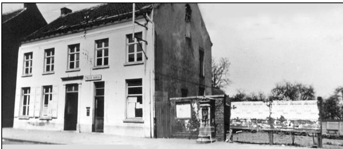
Pand A144, nu Gildenzaal, was toen ons gemeentehuis.