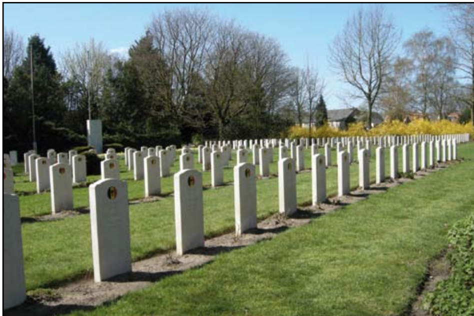
Militaire begraafplaats in Harderwijk, Nederland.