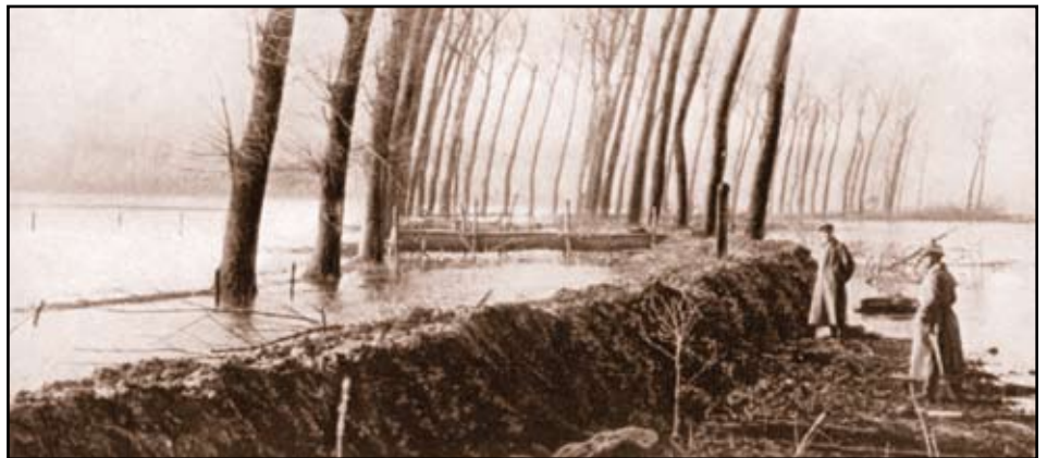
1914. Onderwaterzetting van laag gelegen weiden.

De 2de divisie werd gelast de voorbereidende werken uit te voeren. De