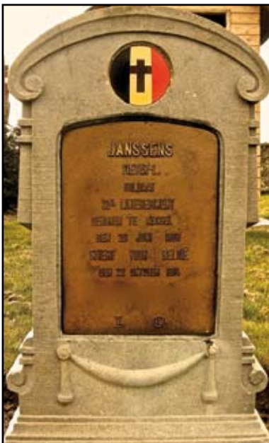
Het graf van Pierre Louis Janssens te Calais.