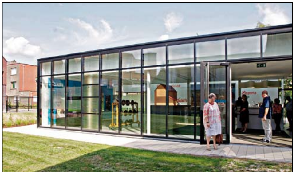
Het Diamantbelevingscentrum in de Spoorweglei 42 te Nijlen.