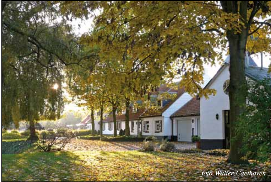
De Sluierhoeve anno 2015 : een oase van rust. Vooraan rechts de kapel.

In de beemden van de kleine Nete, tussen de Vogelzangstraat en de Krekelbeek juist voor de grens met Nijlen, werd ongeveer een halve eeuw geleden 't Hertenhof, 't Reservaat of de Sluierhoeve gebouwd. Ze ontleende deze laatste, poëtische naam aan de mistbanken die hier vaak als een sluier over het vochtige en moerassige landschap zweven.