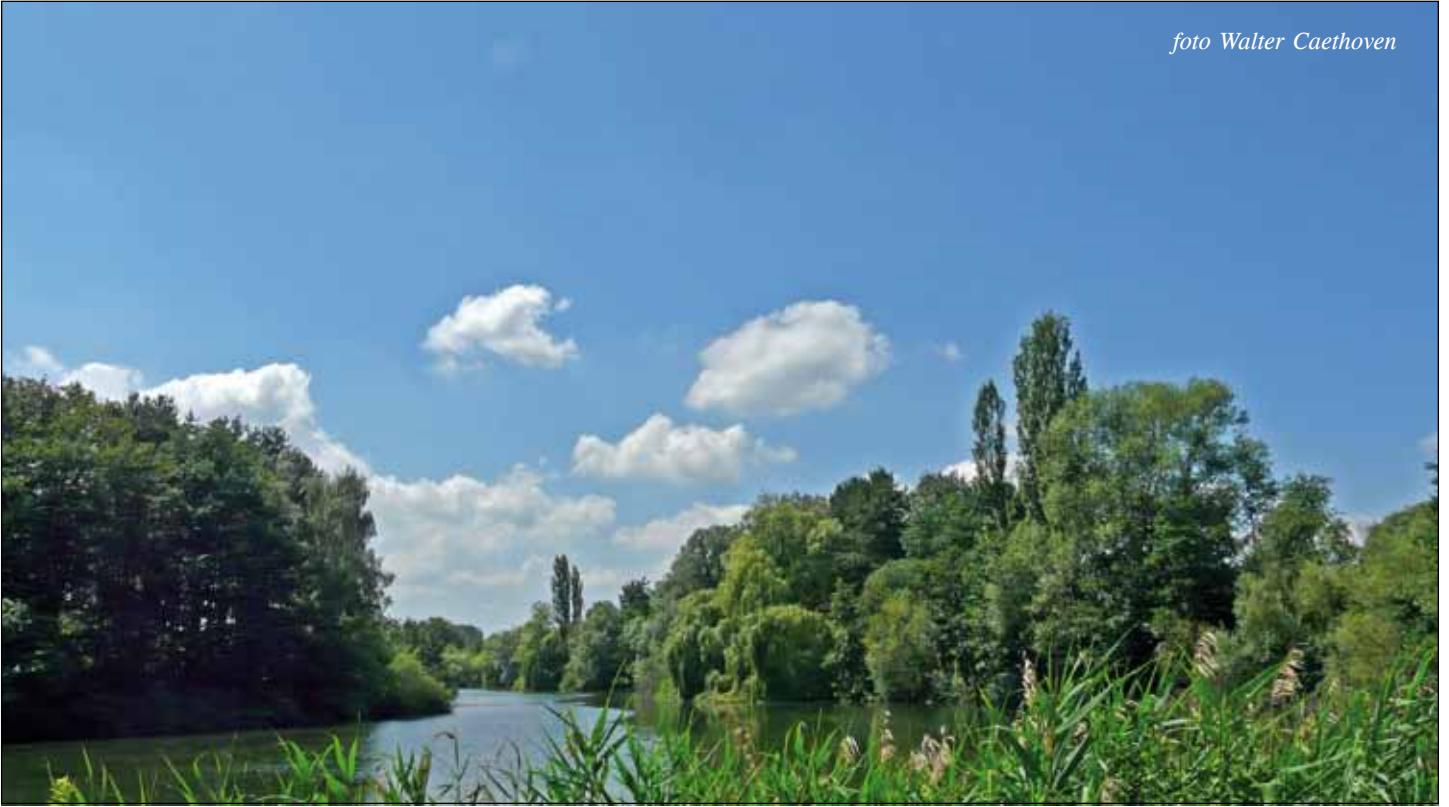
De Netevijvers, vlak bij taverne De Beemden: een uitverkoren, lieflijk rustpunt.

“De late zondagnamiddag hong vredig, kalm en stil over de duizend hooioppers, die riekend in de wijde beemden waren... Over de Nethe, aan de verre witte huizekens, was er traag harmonikagespeel, en een grote klok dommelde voor 't avondlof. Op de Netedijk, en in het hooggetijdewater zuiver weerkaatst, gingen twee kinderen, een in 't rood en een in 't wit, met hun armen vol paardenbloemen, en een zwert spitsken liep snuffelend achteraan. Het licht scheen uit den grond te komen”.