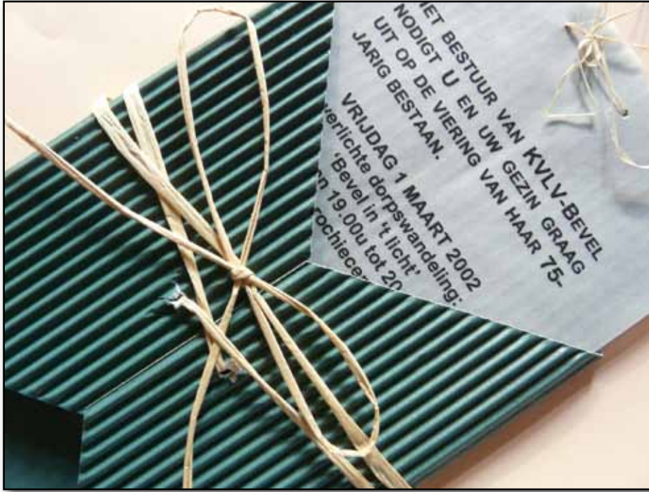
De sierlijke uitnodiging voor de viering van 75 jaar KVLV met "Bevel in 't licht"!

Op zaterdag 8 oktober 2016 organiseerde KVLV Bevel voor de 4de maal “Bevel in 't licht.” Dit om haar 90-jarige bestaan te vieren. Vele wandelaars (meer dan 2000) vonden de weg naar Bevel om mee te genieten van de sfeervol verlichte dorpswandeling met duizenden lichtjes langs de weg, op pleintjes en 350 verlichte huizen en tuinen. Hierbij enkele reacties van wandelaars: