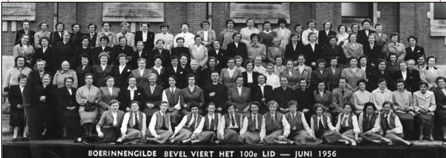
Foto 100ste lid 1956 Boerinnengilde Bevel