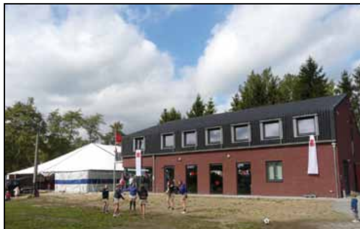
Een prachtig nieuw jeugdheem vraagt ook een nieuwe buiteninrichting!

Voor de historiek: lees onder meer Poemp 93, p. 10-12.