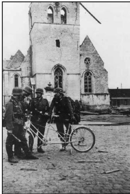
Nijlen, mei 1940. Duitse soldaten hebben een tandem opgeëist. Op de achtergrond de door het Belgisch leger opgeblazen Willibrorduskerk.

Al van in de vroege morgen staan de inwoners van Nijlen in het dorp hun bevrijders op te wachten. Aan veel huizen hangen nu vlaggen, langs beide kanten van de Statiestraat en verder naar Kessel toe staan mensen de bevrijders toe te juichen. Maar ook de Gemeentestraat en de Bouwelsesteenweg zien zwart van het volk: er wordt gedanst, gezongen en veel gedronken. Bloemen werden naar de soldaten gegooid. Nijlen was bevrijd na vier jaar bezetting; het geluk kon niet op. De ene colonne bevrijders na de andere trok in ijltempo door ons dorp. Op het gemeentehuis was men druk bezig om de inkwartiering voor