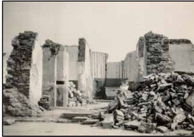
1. Ruïne 1940 Bevel kerk.

Nooit meer oorlog! Vrede! Dat is de universele boodschap van de IJzer-toren in Diksmuide.