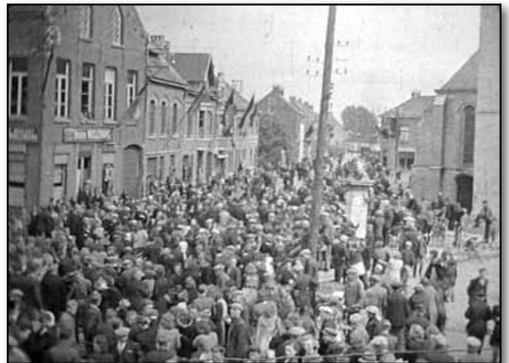
2. Nijlen 1944, kerkplein.

1. Geen wonder dat Bevel de Engelse bevrijders in 1944 hartelijk welkom heette. De vlaggen wapperden enthousiast aan de huizen. Een nieuwe tijd kon aanbreken!