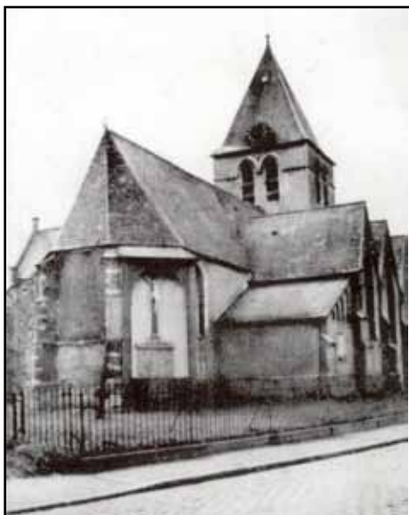
De oude kerk van Bevel.