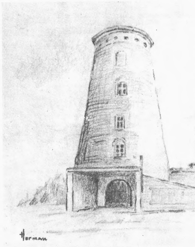
L. Van Regenmortel

En met deze laatste soort hebben wij dan, zij het zeer onvolledig, het rijtje afgemaakt. Over een paar maanden wordt het weer lente, dan keren onze trekvogels terug en kunnen wij weer onze zwaluwen hun ongeëvenaarde vliegprestaties zien ten beste geven.