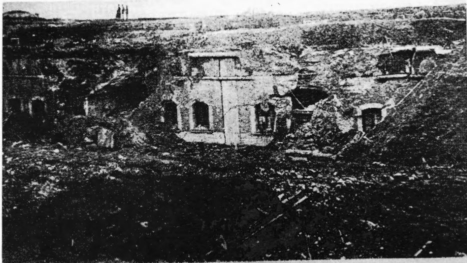
Fort Kessel Die durch zwei Treffer zerförte Hauptkaserne.

De door twee voltreffers verwoeste hoofdkazerne van het fort.