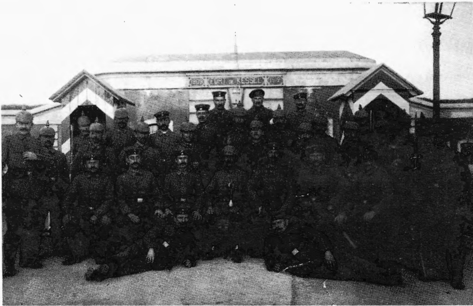
1914. Grauwe ulanen waren die eerste dagen van oktober binnengevallen. Het waren gevreesde keurtroepen. Dit beeldje ging al vroeg naar het Duitse thuisfront. Een groepje 'pinhelmen' poseert hier voor het gevallen en ingenomen fort. 'Stoere jongens', zal je wellicht denken bij het bekijken van al die zwaar besnorde elite soldaten!

Geleidelijk aan verminderde echter de belangstelling voor het fort. In de oorlogsjaren had men andere katten te geselen en later eisten andere gebeurtenissen de belangstelling op. Ook van officiële zijde werd er nog weinig over het fort gerept. Een normaal verschijnsel. Een flop wordt meestal doodgezwegen en niets wordt zo gemakkelijk vergeten als iets dat men wil vergeten.