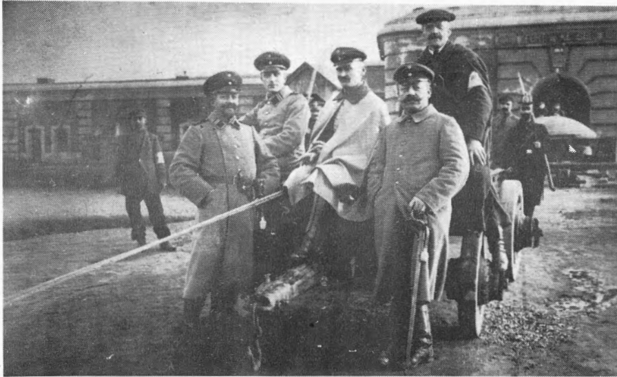
Tijdens de eerste oktoberdagen van het jaar 1914 werd het fort letterlijk 'ondersteboven' gebombardeerd door de Duitse artillerie. Zo raak hadden ze geschoten. Een niet ontplofte obus was recht op een geschutstoren gevallen en 'stak er als een naald in'. Als bewijs van hun kunde lieten de bezetters deze koepel uitbreken en naar hun 'Heimat' overbrengen. En kijk hoe fier en zelfverzekerd ze bij deze ongewone oorlogstrofee poseren.

plannen in huis zal komen is, nu door de fusies van gemeenten Kesselfort Nijlen-fort zal worden, moeilijk te zeggen. Het gedeelte binnen de vestingsgracht, het eigenlijke fort zelf, zal nog wel een tijdje blijven zoals het er nu uitziet. Zonder ingrijpen van de mens kan het zelfs nog eeuwen meegaan.