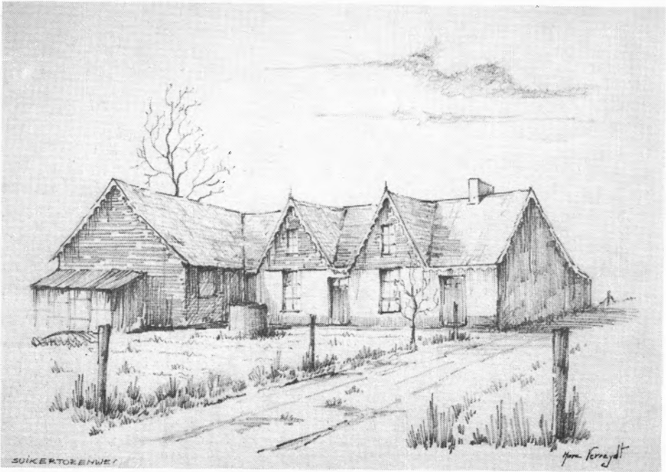
Dit huisje in de Suikertorenweg werd jarenlang 'Villa Servitude' genoemd omdat het gespaard bleef ondanks het feit dat het in de linie lag.

Maar wat nog het meest kwaad bloed zette was de vaststelling dat er in de "Linie" enkele huizen waren blijven staan die volgens recht ook hadden moeten verdwijnen.