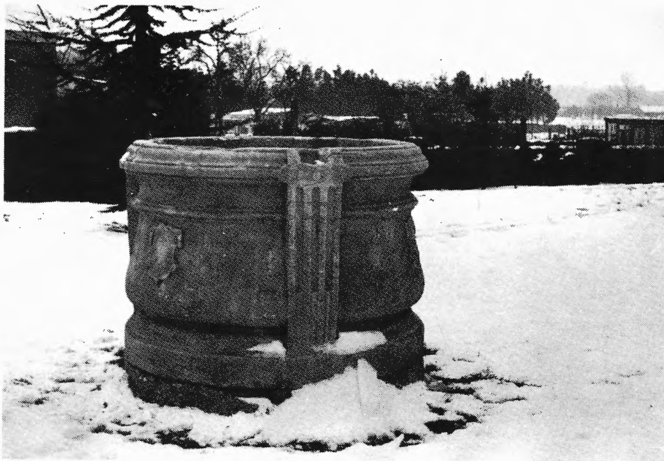
Putkuip van het 'Goed ten Dijke' oorspronkelijk uit één steen gehouwen. ca 1700