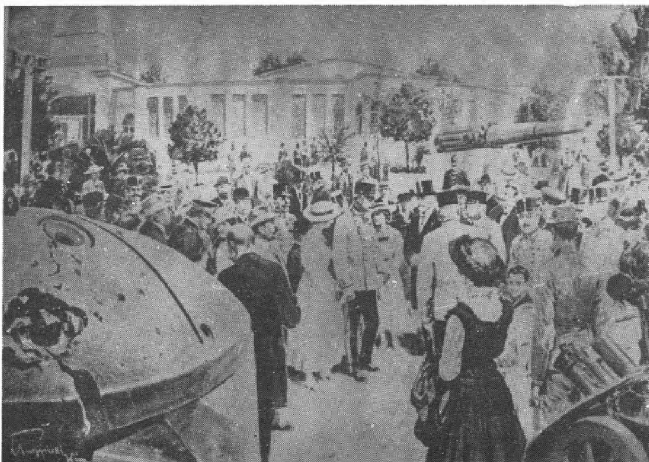
Geschutskoepel van het fort van Kessel op de tentoonstelling te Wenen.

Ook in de dorpskom werden enkele huizen door bemiddeling van een Zwitserse liefdadige stichting in eenzelfde stijl heropgebouwd. Ze zijn te herkennen aan de letters 'O. S. B.' (Oeuvre suisse en Belgique - Zwitserse Stichting in België) boven de voordeur en hun merkwaardige pseudo-Rococo-stijl.