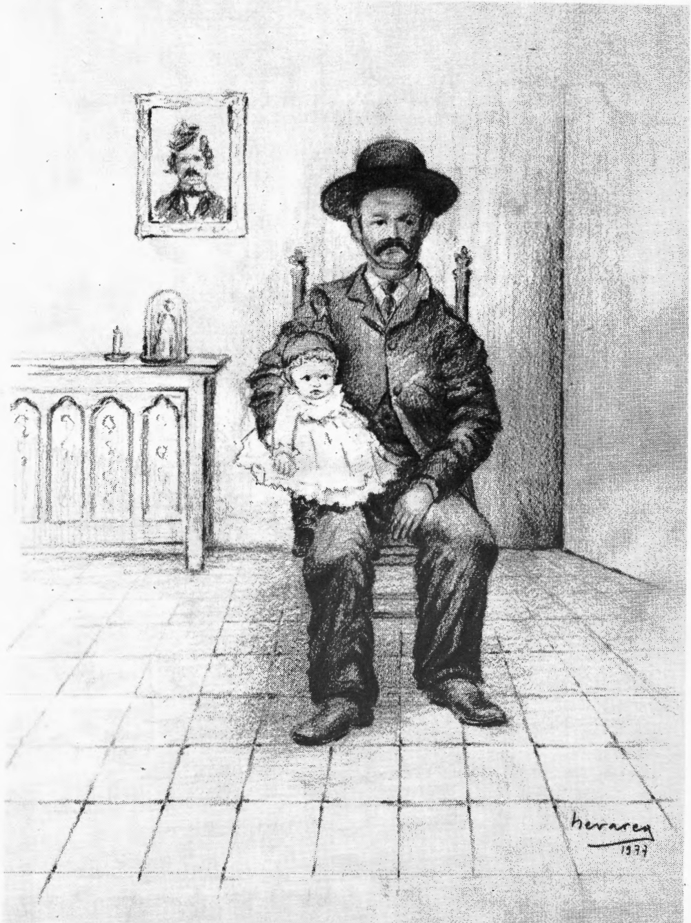
Aangifte op het gemeentehuis van Jean de la Bruyère....