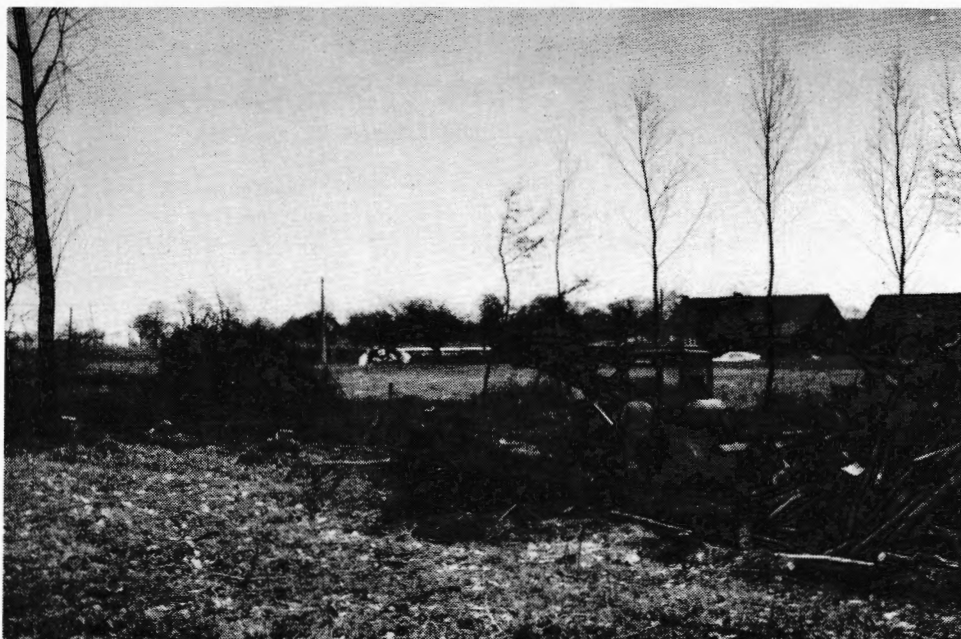
Beschermd natuurgebied volgens 't gewestplan ! Leve de anarchie !