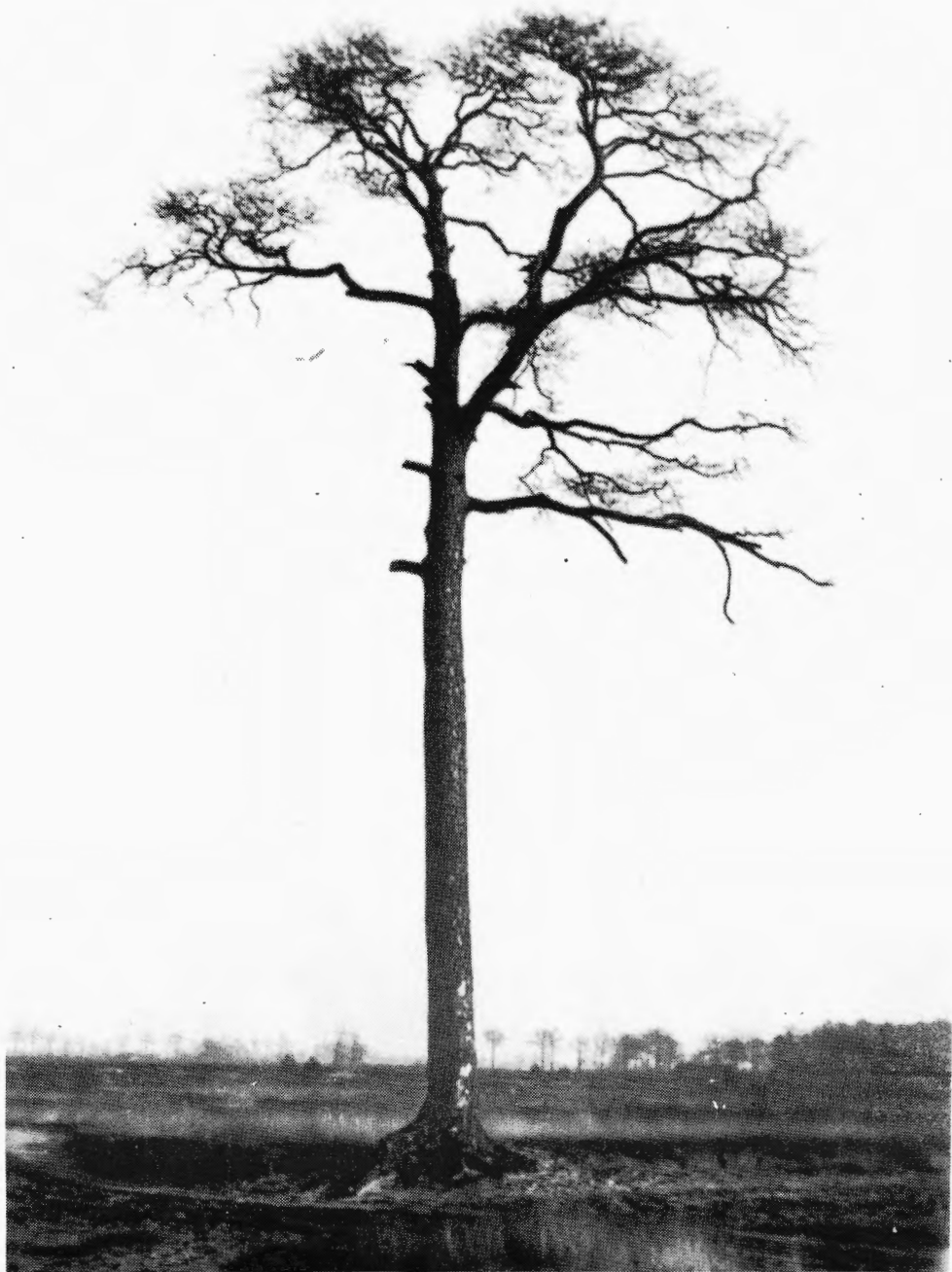
'Den dikken boom' of ook wel 'de mastenboom' was een veilige wegwijzer over dag en een angstaanjagende gestalte bij nacht.