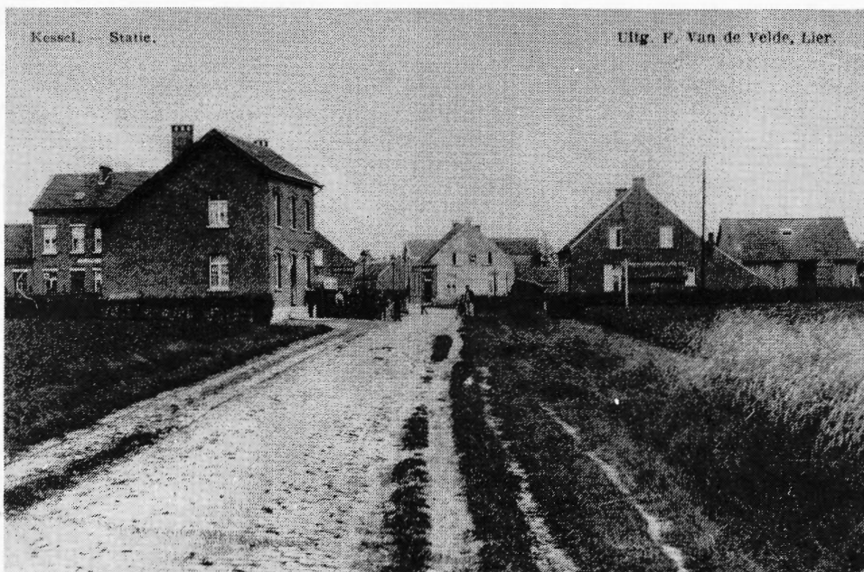
Kessel-Statie in 1911. Het uitzicht was tot in 1943 ongeveer hetzelfde. Rechts op het korenveld staat nu de pastorie en tussen de spoorweghaag en dit veld ligt het huidige kerkplein.