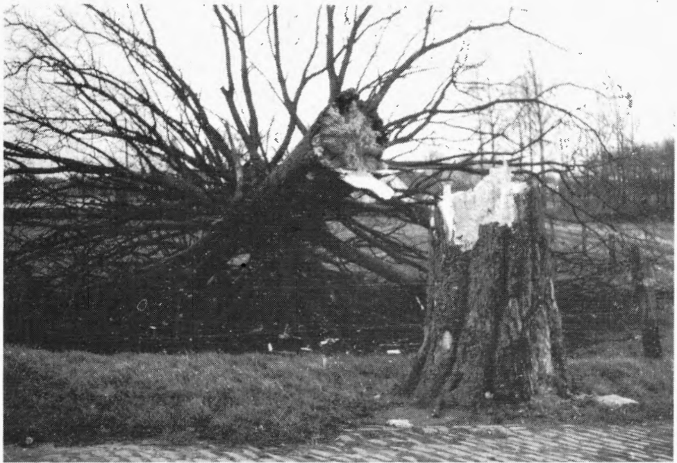
Onze zo vertrouwde 'Linnenboom' knakte af tijdens de stormnacht van 23 op 24 december 1977. Hierdoor is weer een stukje 'Kessel' voor altijd verloren gegaan.

Was hij niet de oudste noch de mooiste boom uit ons dorp, de best gekende was hij zeker. Wie zal er zeggen hoe dikwijls hij het einddoel was van een avondwandeling? Hoeveel duizende jonge duiven werden er voor het eerst 'gelapt' onder zijn kruin? En hoeveel jonge koppeltjes hebben er tegen zijn dikke stam staan 'liflaffen'?