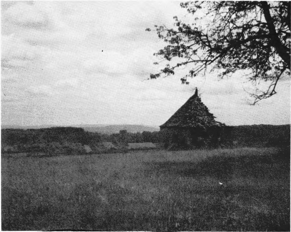
Prachtig kluizeke ergens in het hartje van Frankrijk.