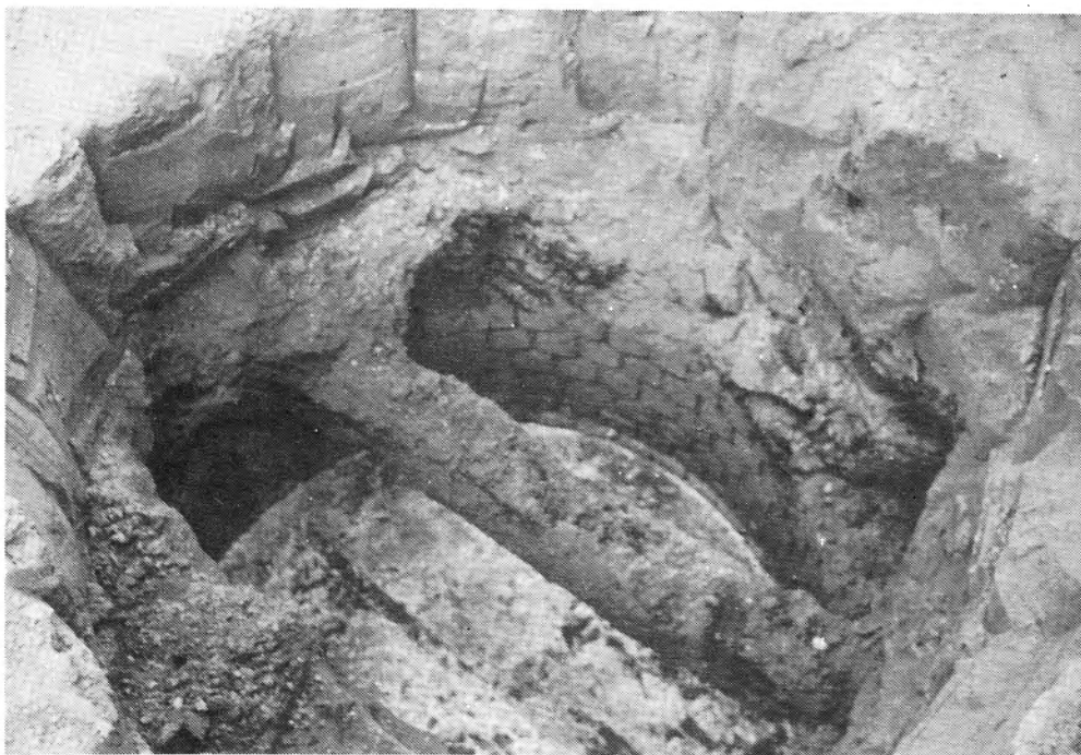
Detail van de gemetselde put. Duidelijk zichtbaar zijn de eiken balken waarmee de put in 1914 werd dichtgelegd.

Tijdens de eerste oorlogsdagen van 1914 zou er een Duits soldaat in de hoeve zelfmoord gepleegd hebben. Zo luidde althans de officiële versie. Zware bloedsporen liepen van aan de voordeur dwars door het huis tot in één der slaapkamers. Het gaf meer de schijn dat er een stille koelbloedige afrekening gebeurd was onder de soldaten zelf. Om een vervelend onderzoek naar de reden van de moord of zelfmoord te vermijden rolden zijn 'kameraden' hem in een deken en zonder de minste plichtplegingen gooiden ze het lijk in een gemetselde waterput die op het erf van de Dobbelhoeve langs de straatkant van de Salvatorbaan stond. Om de sporen van wat er allemaal in stilte gebeurd was weg te moffelen werd de oude gemetselde waterput met eiken boomstammen dichtgelegd. Hierboven werd een halve meter grond gegooid. Geen haan zou er nog over kraaien. Een arme duivel had een droevig einde en een nog droeviger graf gevonden.