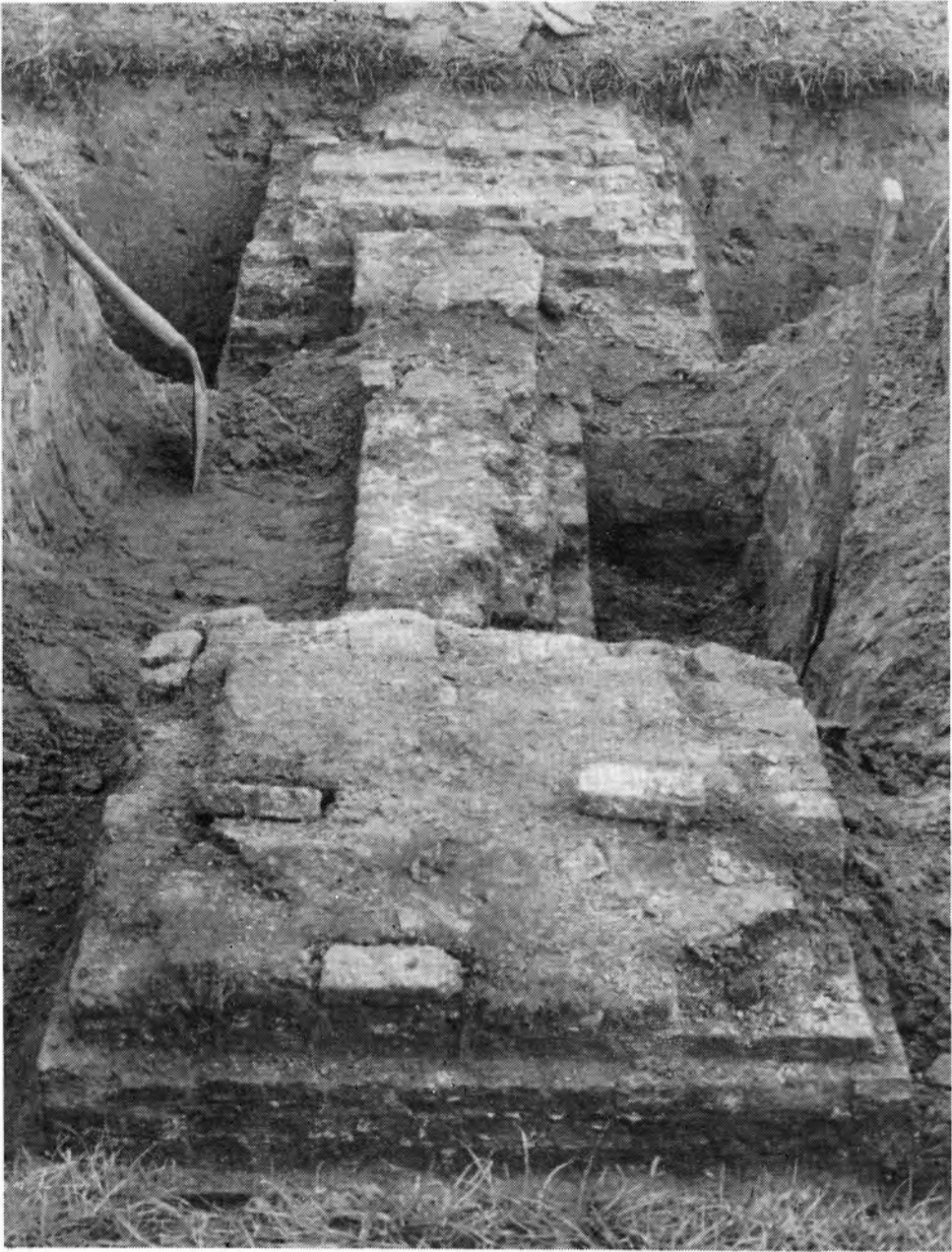
Funderingen van het poortgebouw waarlangs men op de binnenkoer van het kasteel belandde, gelegen langs de eeuwenoude verbindingsweg tussen de Terlaakenweg en de Bartstraat, onlangs op een onwettige wijze afgesloten.