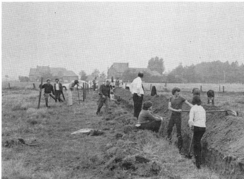
Algemeen zicht op de opgravings-sleuf dwars door de weide; leden van de Antwerpse Vereniging voor Bodem- en Grottonderzoek, leden van Kindervreugd en enkele Kesselaars. Achteraan de twee gekende typische hoeven langs de Lierse Steenweg.

De opgravingen hebben een verrassend licht geworpen op een stukje Kessels verleden. Een 'proefsleuf' dwars door de weide getrokken bracht heel wat aan het licht. Toen de eerste spade in de grond gestoken werd had men al beet. Vooraan in de weide lagen de funderingen van een oud poortgebouw. Een eindje verder stootte men op de peiler van een ophaalbrug die een gracht van circa 8 m breedte (midden in de weide gelegen) overwelfde. Het kasteel dat hier stond was dus, zoals het Rameyenhof te Gestel, een echte waterburcht opgetrokken in Brabantse stijl. Tot