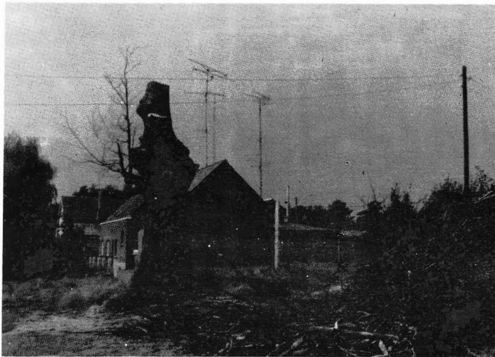
Den dikken beuk was ongetwijfeld de merkwaardigste boom van heel Kessel-Statie. Zijn stam mat aan de onderkant 5,20 m omtrek en op manshoogte nog 4,50 m.