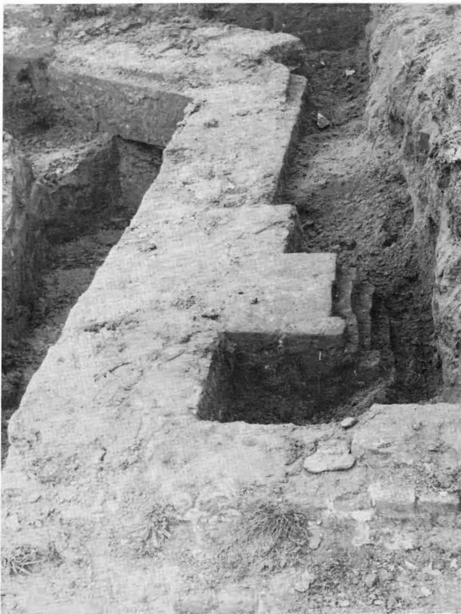
Funderingen van het laatste kasteel dat gebouwd werd omstreeks 1800 en dat in 1914 door het Belgisch leger werd in brand gestoken. (Zie onze artikels ' Fort de Kessel ')