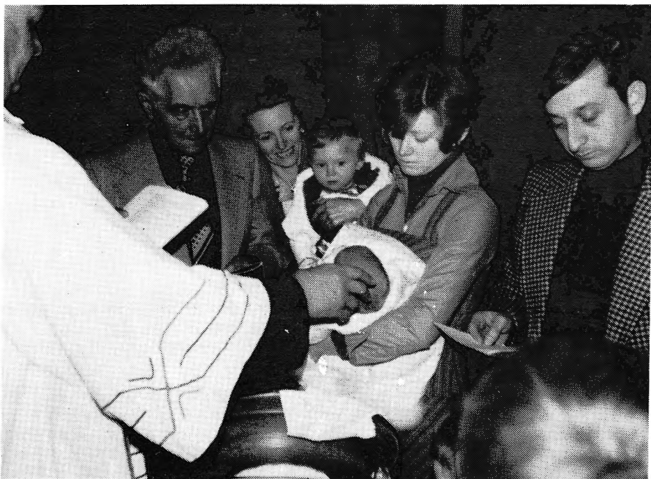
Familiefoto van Dokter Albert De Vriendt.

In alle stilte werd hier op 2 maart 1979 dokter De Vriendt ten grave gedragen. Hij was een uitzonderlijk begaafd man die als kinderspecialist te Turnhout van een haast legendarische faam genoot. Tot ver in het buitenland werd zijn kennis gewaardeerd. Zijn wetenschappelijke bijdragen werden in zowat alle Europese talen vertaald. Zijn uitzonderlijke begaafdheid ging gepaard met een even ongelooflijke werkkraft. Noodgedwongen had hij zich de laatste jaren in stilte teruggetrokken op zijn geliefd Goorkasteeltje.