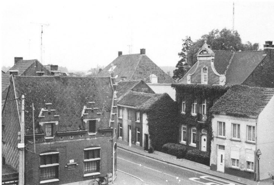
Van op één der zolders van de Lieve-Vrouwekapel deze interessante opname die een heel stukje geschiedenis van ons dorp oproept.

Maar keren we terug naar onze foto en vergelijken we dit beeld met ongeveer dezelfde fotografische opname die we op de oude prentkaart zien (circa 1900). Op de hoek links, 'de Vrede' tot voor een tiental jaartjes terug nog een echte dorpscafé. Verwoest in 1914, en, zoals de votiefsteen in de zijgevel zegt, heropgebouwd in 1920. Voor 1914, duidelijk leesbaar op de oude prentkaart, heette deze hoek 't Schippershuis, herberg'. Een vreemde naam in een dorp dat wel heel wat water en waterlast heeft, maar dat toch ver van dat water en hoog en droog ligt. De dorpskom althans !