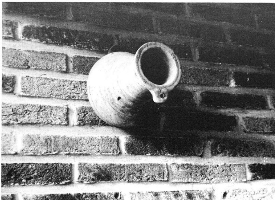
De spreeuwpot is een kruikvormige of bijna bolronde pot met smalle hals uit aardewerk.

Zeker is dat in sommige delen van Duitsland, de spreeuwpot zou gebruikt zijn om binnen handbereik over vers vlees te kunnen beschikken, dit in tegenstelling tot Nederland waar humanere maatstaven zouden gehanteerd zijn en men er meer van uitging ze ergens op te hangen uit liefde tot de vogels.