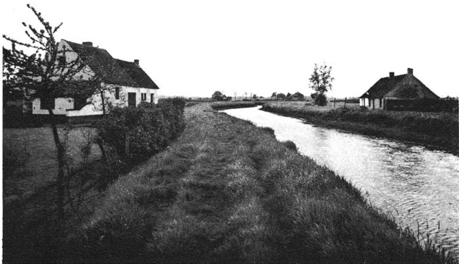
Als een vreedzame oase lag 't Seppeke eenzaam en verlaten aan de waterkant, omgeven door schier eindeloze lage beemden zonder één enkele boom. Foto uit de jaren dertig.

sant heeft, in het gras of tegen de gevel gezeten, zijn klompen en kousen uitgetrokken en vervolgens de broekspijpen opgestroopt om door de Nete te waden. Aan dat 'doorbadem' was soms ook een plezierige kant verbonden want meer dan één stuiver werd er verdiend met het vrouwvolk op de rug te nemen en naar de overkant te dragen ! Vele boeren en voerlui hebben uren gewacht (toen konden ze nog wachten) op het lage tij om met paard en kar door de Neet te rijden, toen waren er immers nog geen dijken zoals nu ! De straat, die eigenlijk maar een breed karrespoor was, liep aan de overkant langs de pastorie recht naar Emblem kerk.