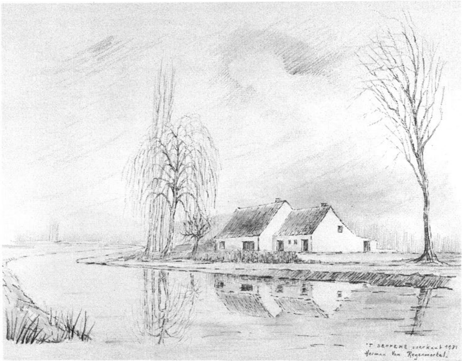
't Seppeke gezien vanop de noordelijke Emblemse oever.

Maar zoals Mevrouw Van Giel-Mols ons terecht doet opmerken is haar overgrootvader, Jan Bossaerts, ook cafébaas geweest bij de overzet, zodat we van hem ook kunnen zeggen wat in een dorp in het Brabantse op een uithangbord stond te lezen :