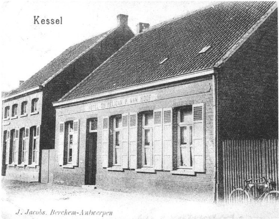
J. Jacobs. Berchem-Antwerpen

De grootste konkurrent van Fien de Smet is altijd Marie Kets, vlak over haar deur, geweest. In deze zeer oude kruidenierswinkel, die nu al vele jaren verdwenen is, kon je net zoals bij Fien de Smet ook van alles krijgen. Tegelijkertijd was het een gekend café en hotel; 'Hotel du Pélican' waar nog een prachtige houten plankenvloer lag die zeer hol klonk wanneer men er over liep. Deze plankenvloer werd regelmatig bestrooid met wit zand.