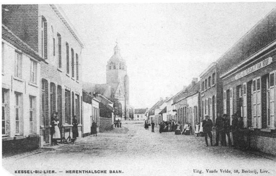
KESSEL-BIJ-LIER. — HERENTHALSCHE BAAN.

Op 31 december 1980 ging de oudste winkel uit ons dorp voorgoed dicht.