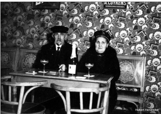
Café Het Zandveld, Broechemsesteenweg 150, +/- 1945.

Geen café zonder zijn baas of bazin, want hij of zij bepaalt in grote mate het succes van de zaak. “Als een kapitein aan het roer van zijn schip, staat de waard(in) steeds paraat achter de toeg”. De uitbater kent de klanten en de klanten kennen de uitbater. Hij of zij is meestal ook gezegend met heel wat vaardigheden: ze kunnen luisteren als de beste en organiseren evenementen op maat van hun publiek. De toeg dient vaak als biecht- of preekstoel, waar de stamgasten na één of niet te tellen pinten, mogen biechten en balen, zingen, zeveren en zagen, schimpen en schelden, stoefen en blazen, krokodillentranen schreien of hun zotte vreugde uitschreeuwen en kortom “hunne zeg mogen doen”.