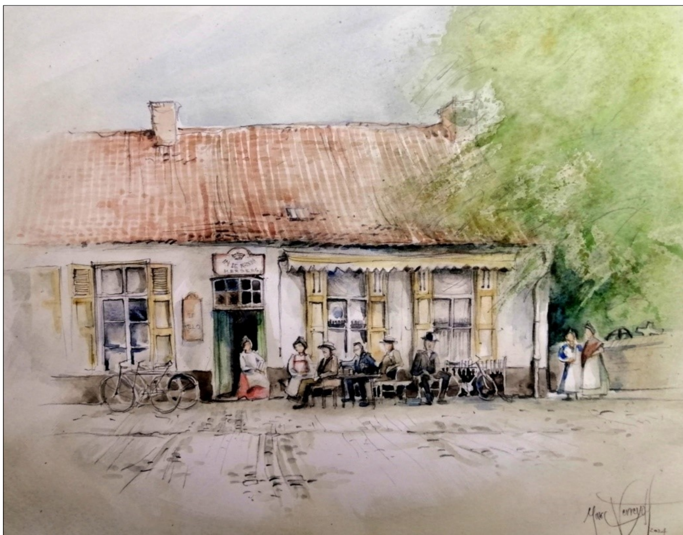
De Kroon bij 'Mieke van de Dikke' aan de St-Lambertuskerk in Kessel rond 1900 aquarel Marc Verreydt, gebaseerd op een authentieke foto.

Veel volkscafés waren bij de lokale bevolking vaak beter gekend onder een andere naam dan de officiële. Die bijnaam was (en is) meestal onlosmakelijk verbonden met de café-uitbater of die van een paar generaties geleden.