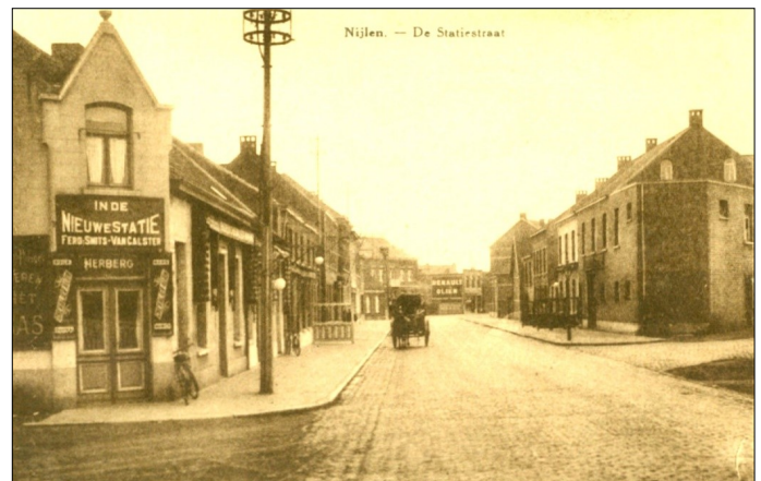
Statiestraat Nijlen +/- 1930.

Een andere naam edi wel in elke gemeente opduikt in die periode is ' Huis Ten Halve '. Deze herbergen stonden altijd op de grens met een andere gemeente (half in de ene, half in de andere). Bij ons waren er drie: op de Liersesteenweg in Kessel bij de grens met Lier, op de Heikant in Bevel op de grens met Herenthout en op de Broechemsesteenweg op de grens met Ranst.