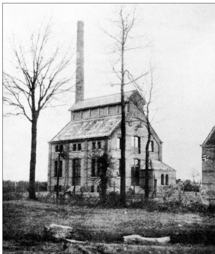
Brouwerij Salvator (of Van den Eynde), was gelegen aan het begin van de Oude Bevelsesteenweg. Later nam Louis Van Loock de brouwerij over. In de jaren '60 vestigde Janssen Sport zich in het gebouw, dat werd aangepast en een nieuwe gevel kreeg. In 2012 werd het originele gedeelte opnieuw in ere gesteld en geïntegreerd in het nieuwe appartementencomplex dat toepasselijk de naam 'De Brouwerij' kreeg.

Tot een stuk in de 20 ste eeuw waren brouwers zeer kapitaalcrachtige burgers. Zij waren eigenaar van verschillende handelspanden en huizen. Wie die wilde huren, bouwen of verbouwen en daarvoor een lening nodig had, kwam meestal terecht bij de brouwerbiersteker. Zijn hulp hield dan wel de verplichting in tot het verkopen van bier.