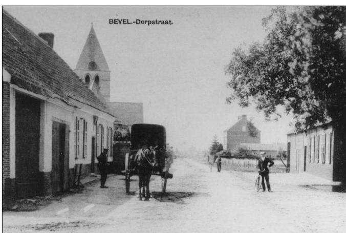
Bevel-Dorp +/- 1900.

Veel namen van cafés vinden hun oorsprong in de natuur, zoals Herberg 't Bergske in de Kerkstraat, of in de religie zoals In Den Engel in de Statiestraat. De naam kon ook een verwijzing zijn naar het beroep van de uitbater, denk maar aan Het Scheermes op de Nijlensesteenweg in Bevel. Of er werd met de naam meteen iets over het gebouw prijsgegeven, zoals bij Het Groenhuis in Kessel-Dorp. Er werd ook graag hulde gebracht aan de grotere steden met cafénamen als In Parijs (Bevel-Dorp). Tot slot kon de benaming ook refereren naar de oude kentekens (wapens) van belangrijke families of organisaties, zoals bij Den Rooden Leeuw in het centrum van Bevel.