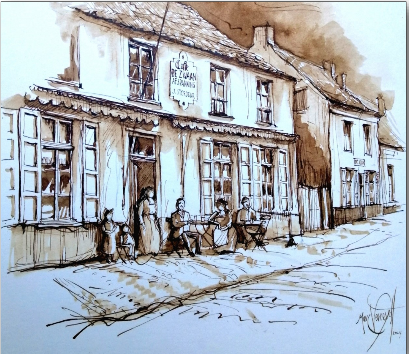
Afspanning De Zwaan Kessel +/- 1900