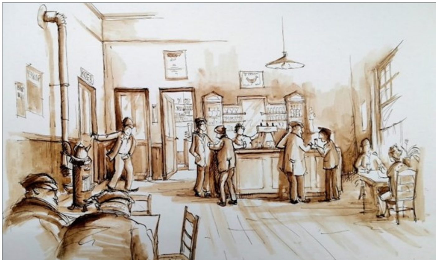
Staminee De Vrede in Kessel-Dorp – sepia Marc Verreydt