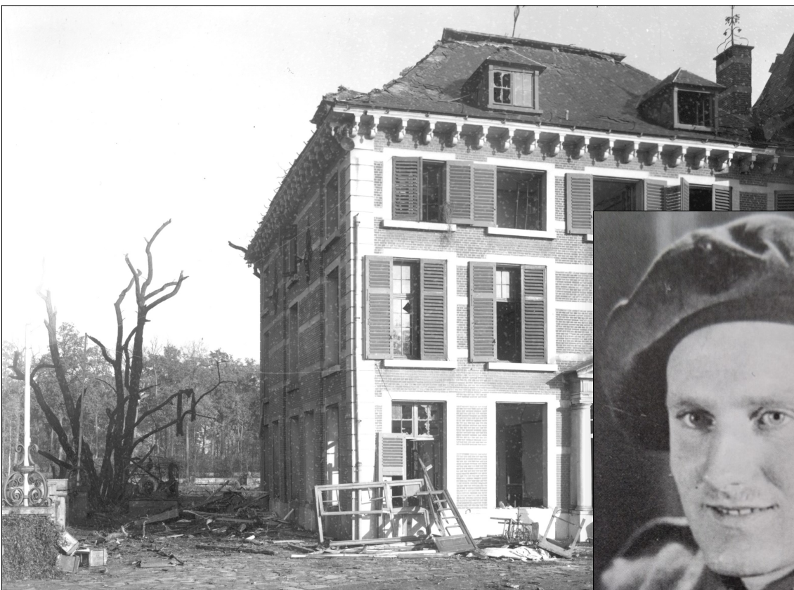
Kasteel De Bist 1944