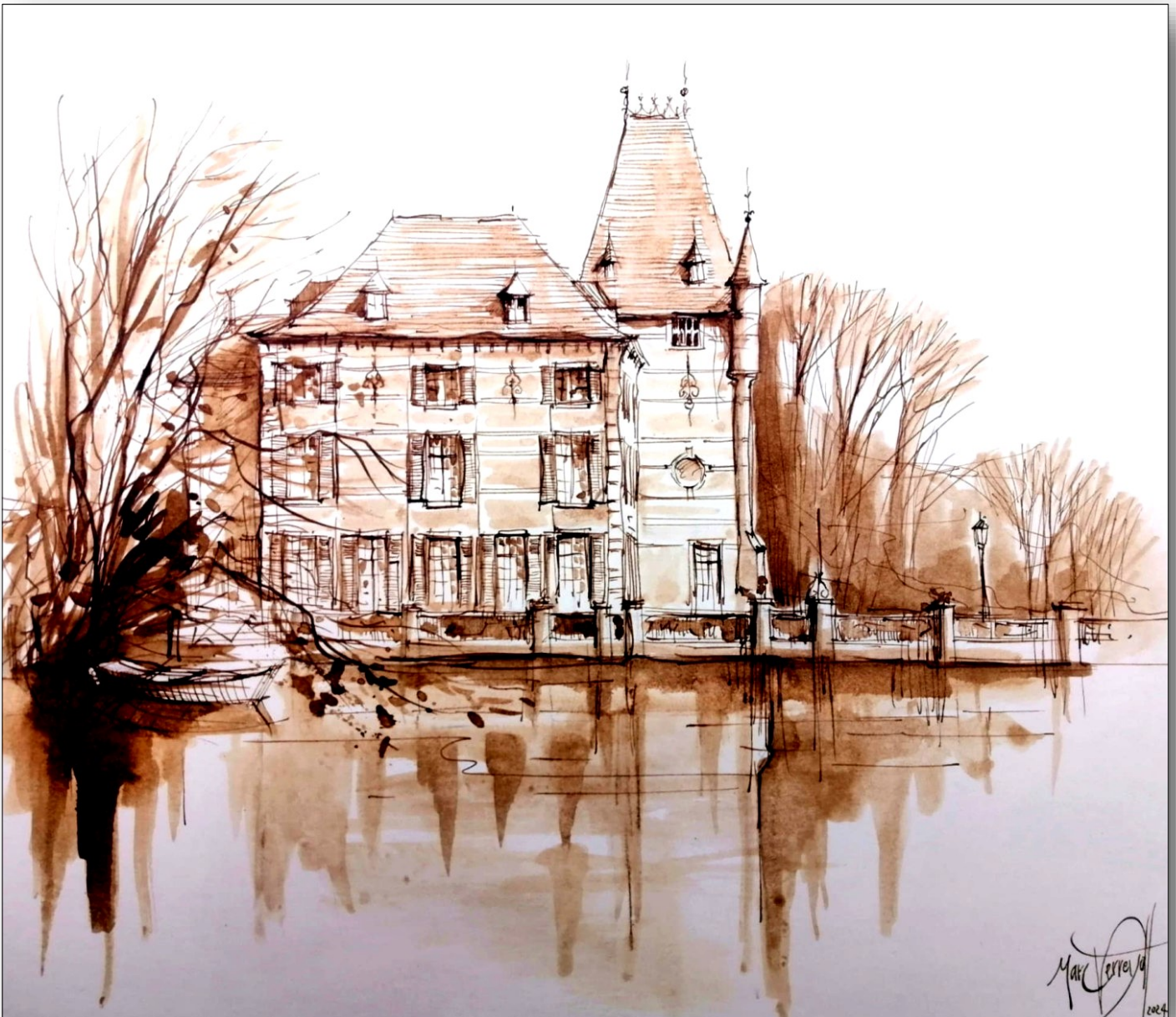
Kasteel De Bist 1940