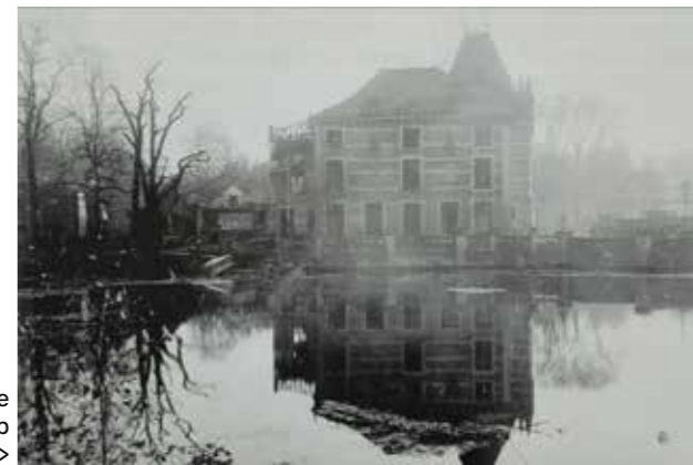
Het verwoeste kasteel vanop afstand >