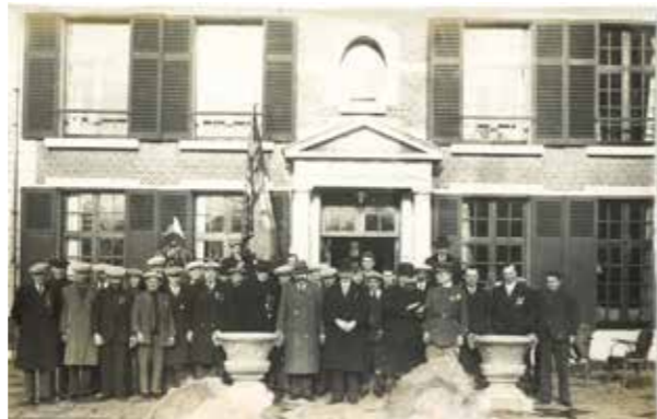
Samenkomst van Kesselse oudstrijders aan kasteel De Bist - 1937