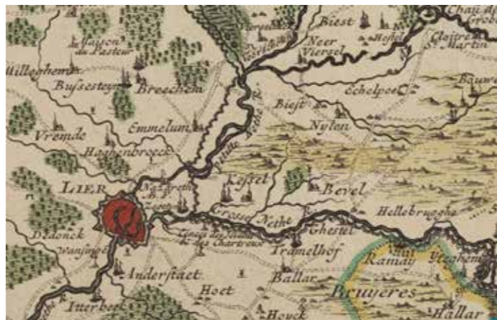
^ Frickxkaart - 1712

Karel II, koning van Spanje, was zonder troonopvolger na te laten, in 1700 overleden. Met zijn goedkeuring was het geregeld dat na zijn dood, Frankrijk in het bezit zou komen van onze gewesten. Spaanse en Franse troepen organiseerden samen één front. Er werd op gerekend dat het geschil in de Spaanse Nederlanden, dus hier bij ons, zou uitgevochten worden. In de omgeving van het 'Kappelleke' aan de Liersesteenweg, staan op enkele stafkaarten naast het jaartal 1709 twee gekruiste degens getekend. Dit herinnert aan een 'veldslag', een achterhoedegevecht dat hier tijdens de Successieoorlog geleverd werd.