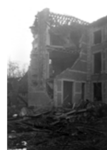
Achterkant van het kasteel en bijgebouwen >