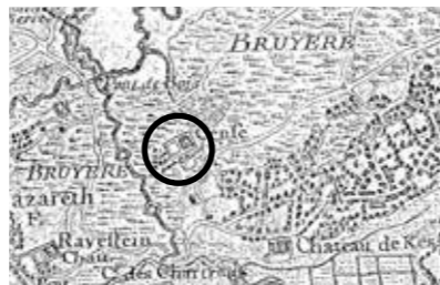
Kaart van Naudin - 1726

verbouwingen aanbrachten aan het hof. Het jaartal 1743 in de zuidgevel van het kasteel maakt duidelijk dat zij opdracht gaven voor de bouw van het hoofdgebouw tegen de vijver.