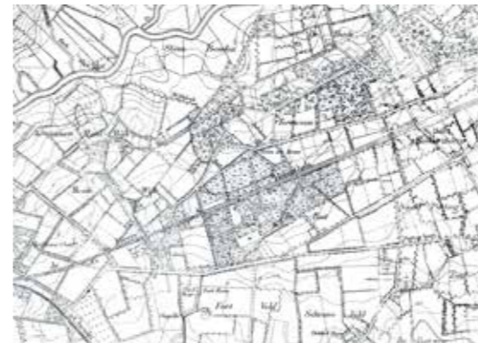
^ Plan Directeur (situatie 19de eeuw)