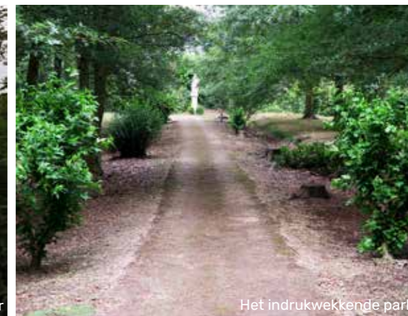
Het indrukwekkende park