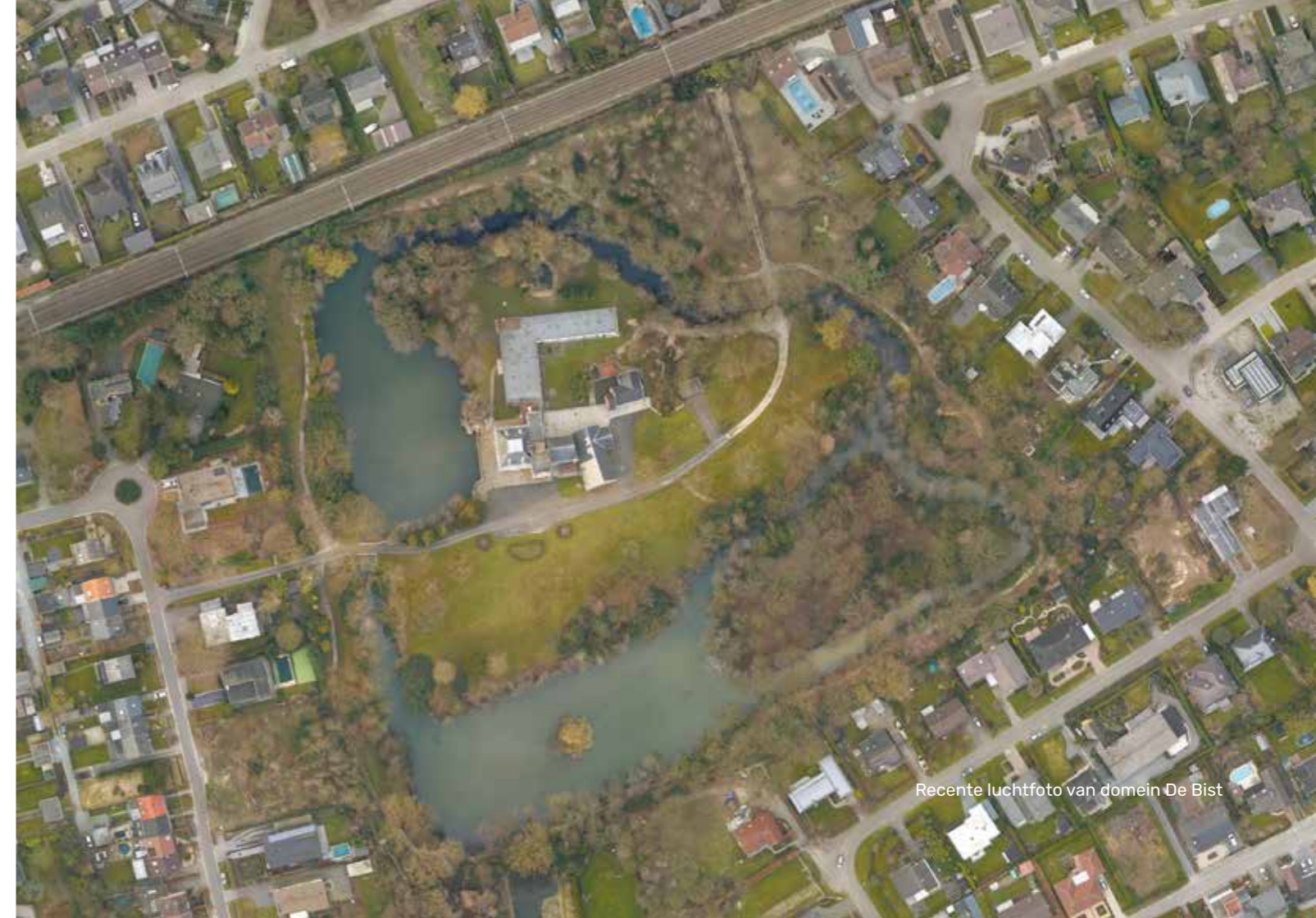
Recente luchtfoto van domein De Bist

Precies 10 jaar later, in 1972, wordt de eigendomstitel gewijzigd in VZW Gasthuiszusters Augustinessen van Lier. Een laatste verbouwing komt er in 1988 bij de bouw van een nieuwe kapel.