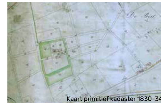
Kaart primitief kadaster 1830-34

verandering maakte het eiland, waarop het kasteel zich bevond, heel wat groter en is tot op de dag van vandaag onveranderd gebleven.