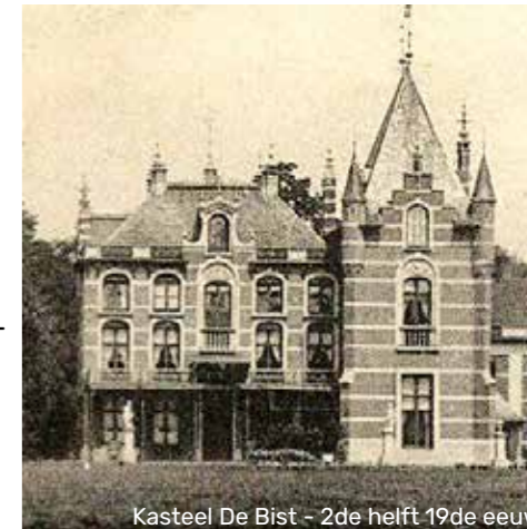
Kasteel De Bist - 2de helft 19de eeuw

Plan architect De Vos - 1928: voorgevel kasteel >>