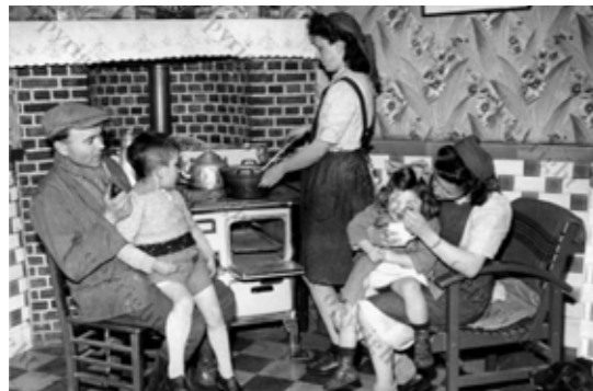
Op 'buitendienst' bij een gezin op het platteland.

Vlaamse Arbeidsdienst voor Vrouwen (VAVV): Deze organisatie had tot doel jonge meisjes uit alle lagen van de maatschappij te leren omgaan met elkaar d.m.v. handenarbeid. Discipline en strenge vorming waren een middel tot opleiding. Dit kwam tot uiting in vormingslessen, lichaamsoefeningen, optochten, kamp- en sport-