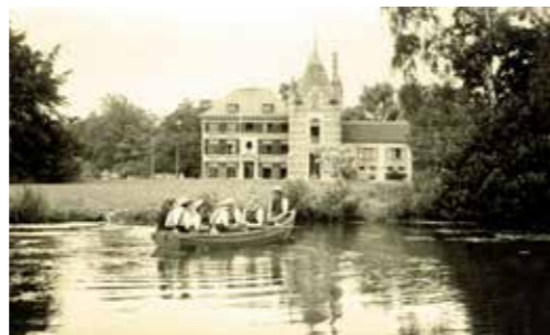
Ook ontspanning was belangrijk.