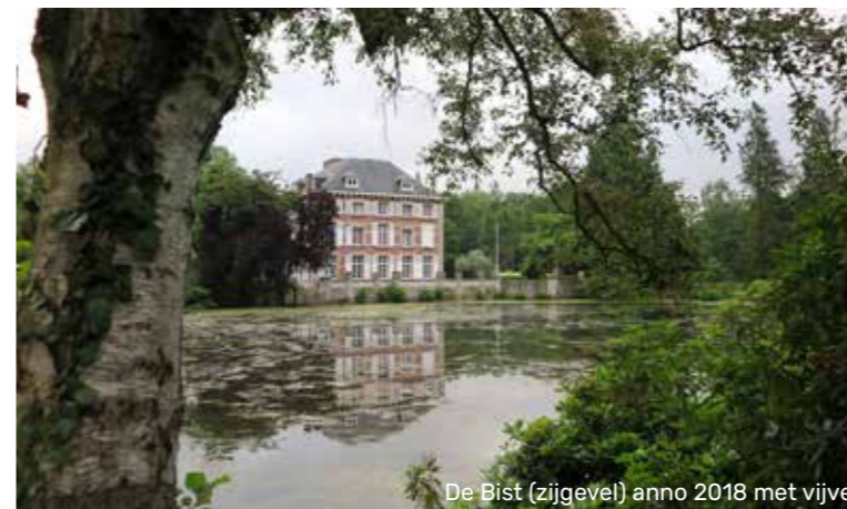
De Bist (zijgevel) anno 2018 met vijver