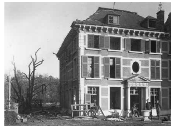
< De V1-inslag liet duidelijke sporen na.

feesten. Na hun vormingsperiode gingen de meisjes in 'buitendienst' werken bij gezinnen op het platteland. Tijdens de Tweede Wereldoorlog kreeg het kasteel twee Duitse aanvallen te verwerken. De eerste, in mei 1940 bracht slecht 'geringe' schade toe aan het torendak en een gevel. Bij de tweede aanval, op het einde van de oorlog, werden het kasteel en de bijhorende woningen grotendeels verwoest.