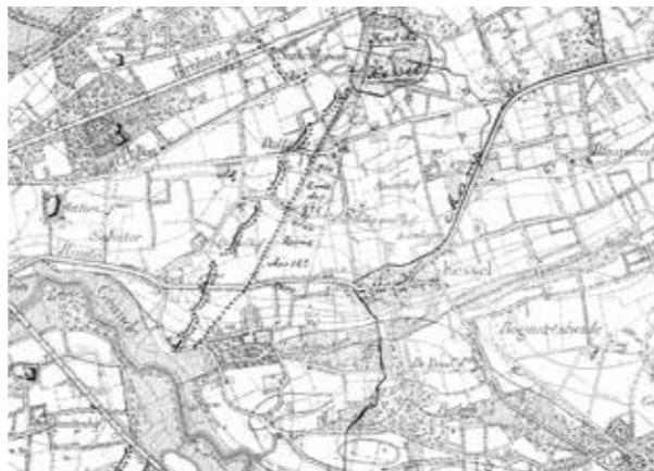
Schootsvelden Fort Kessel - Depot de la guerre 1909