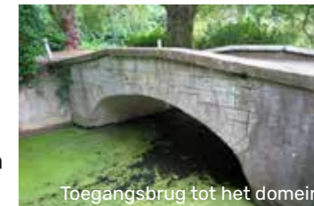
Toegangsbrug tot het domein

Op de zijkant van de brug is nog een datumsteen met verwijzing naar het jaartal 1747 terug te vinden.