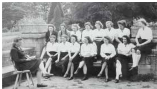
De meisjes van het VAVV krijgen buiten les.