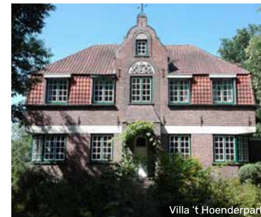
Villa 't Hoenderpark

In de gevel is een wapenschild verwerkt met de spreuk: 'Spes mea in Deo' wat zoveel betekent als 'Mijn hoop berust op God'.