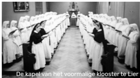
De kapel van het voormalige klooster te Lier

< Houten beeld van Sint-Augustinus, patroonheilige van de zusters, in de kapel