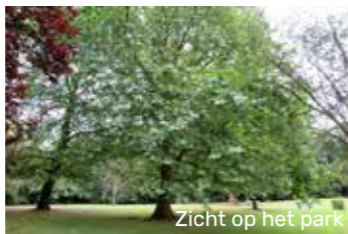
Zicht op het park

Zoals het domein er nu uitziet, wordt het volledig omringd door twee vijvers, die onderling door een brede gracht met elkaar verbonden zijn. Twee bronnen houden het water van de vijvers op peil met een natuurlijke afvoer via de Wolfsbeek naar de