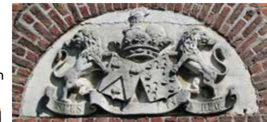
^ Wapenschild familie Gamard