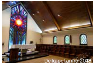
De kapel anno 2018

verlieten ze hun kloostergebouw op de campus van het ziekenhuis aan de Kolveniersvest in Lier om te verhuizen naar het ontmoetings-huis van de congregatie in kasteel De Bist te Kessel.