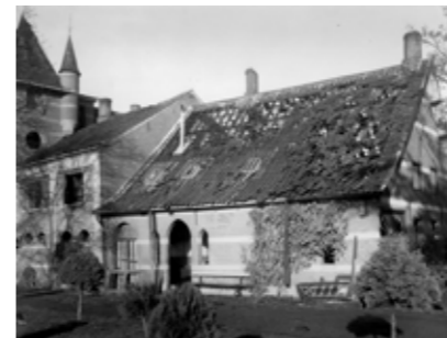
< De vernielingen op 02/11/1944