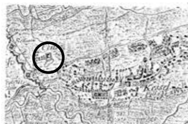
Kaart van Naudin - 1703

In 1739 komt het domein in handen van de Mechelse familie Verhocht. Zij zijn de eerste eigenaars die