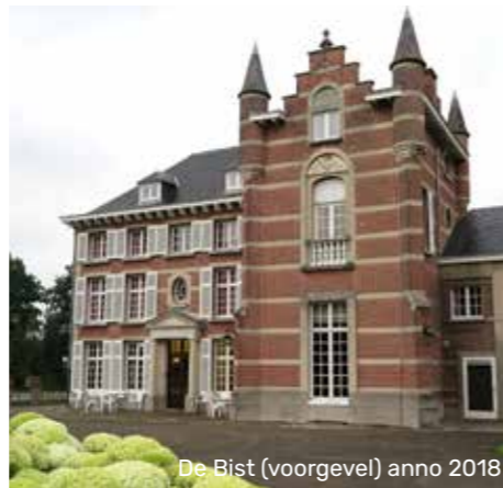
De Bist (voorgevel) anno 2018