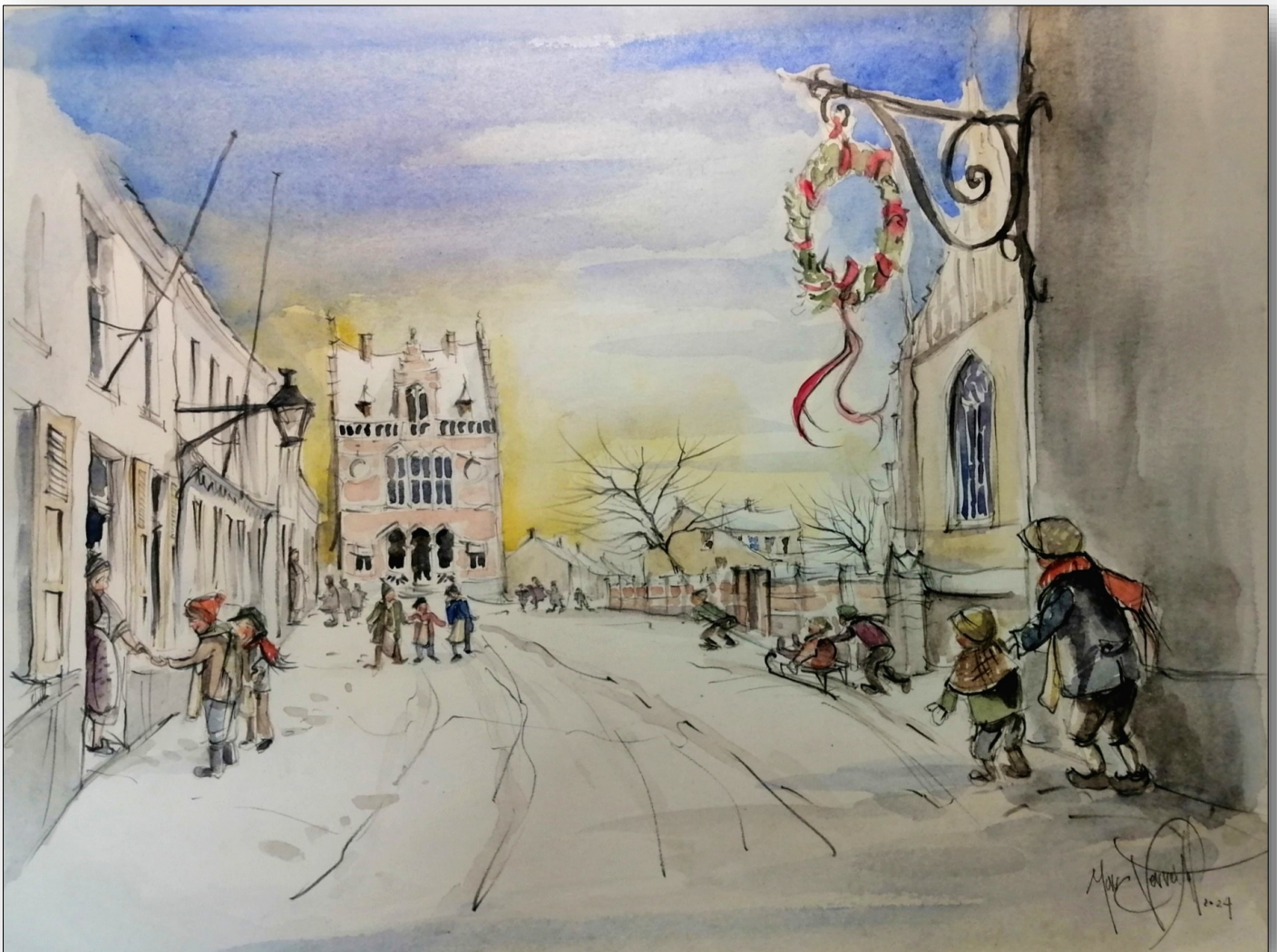
Nieuwjaarre Zoete Kessel-Dorp