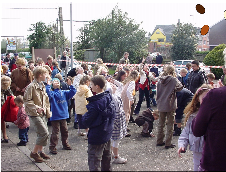
Paaseierenworp vanuit de kerktoren van O.-L.-Vrouw Koningin van de Vrede.

Heb je over de paaseierenworp op Kessel-station nog meer informatie of foto's dan mag je die altijd aan onze Erfgoedkring bezorgen.