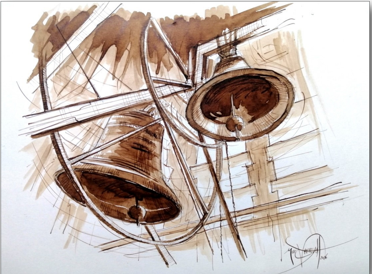
De klokken van O.-L.-Vrouw Koningin van de Vrede