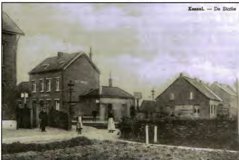
Kessel - Station, begin vorige eeuw, voor een V1 er grote schade aanrichtte.