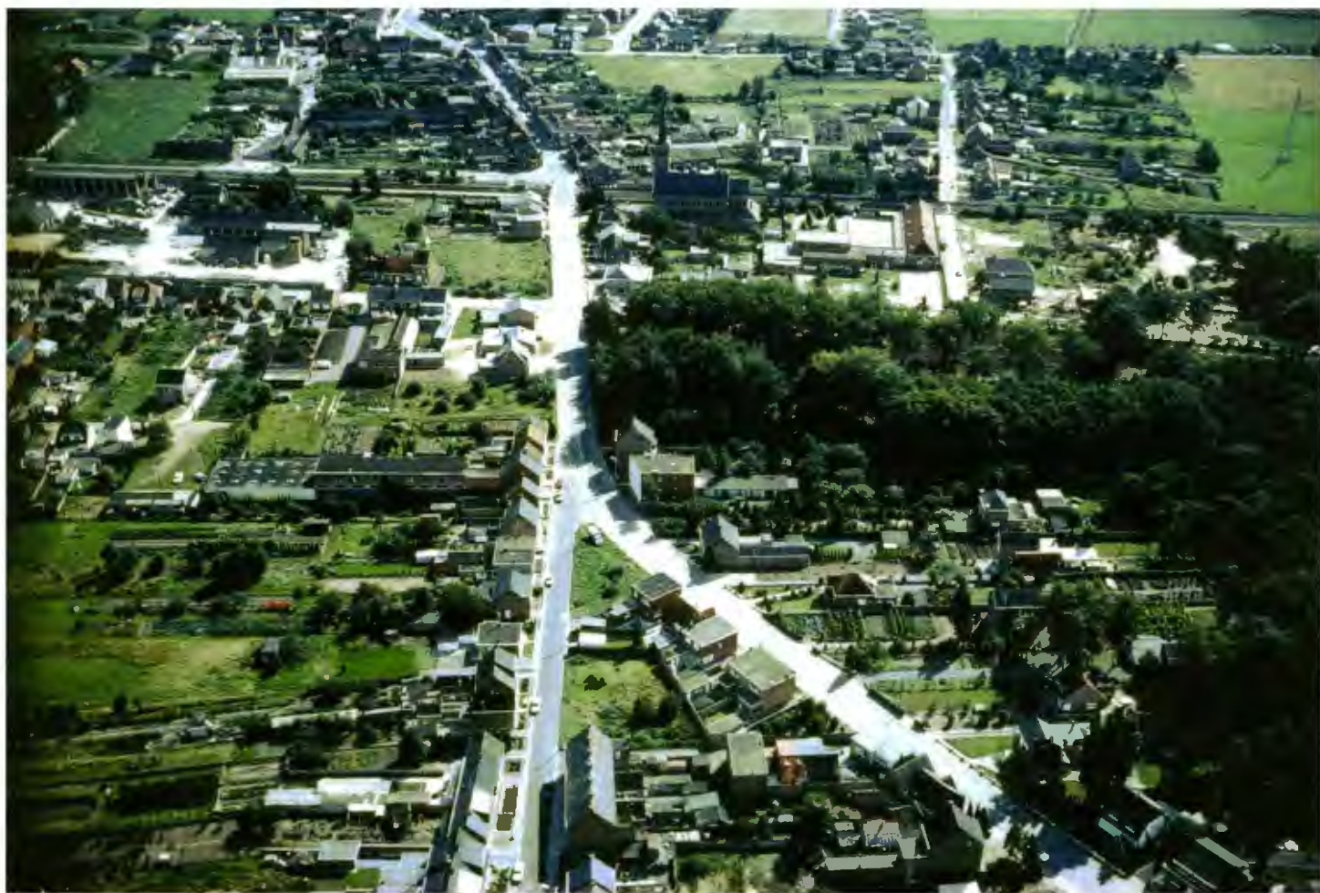
In 1855 telde het gehucht een tiental woningen. Deze foto werd genomen in 1976. Kessel - Statie telde toen 3500 inwoners.

In 1935 kreeg de firma voor bouwmaterialen De Vos-Kets een aansluiting aan de noordzijde.