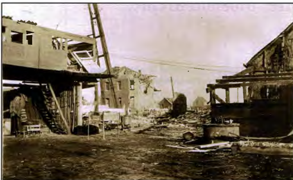
Op 11 november 1944 viel een V1 nabij de overweg. De wachterswoning werd vernield en het station zwaar beschadigd.

Herman Van Regenmortel : Trein in Kessel van stoom tot stroom in Salvator juni 1981.